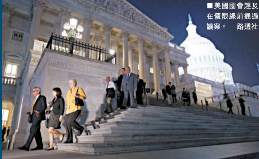
美國國會趕及在債限線前通過議案。