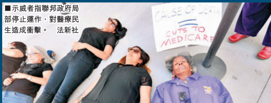
示威者指聯邦政府局部停止運作，對醫療民生造成衝擊。