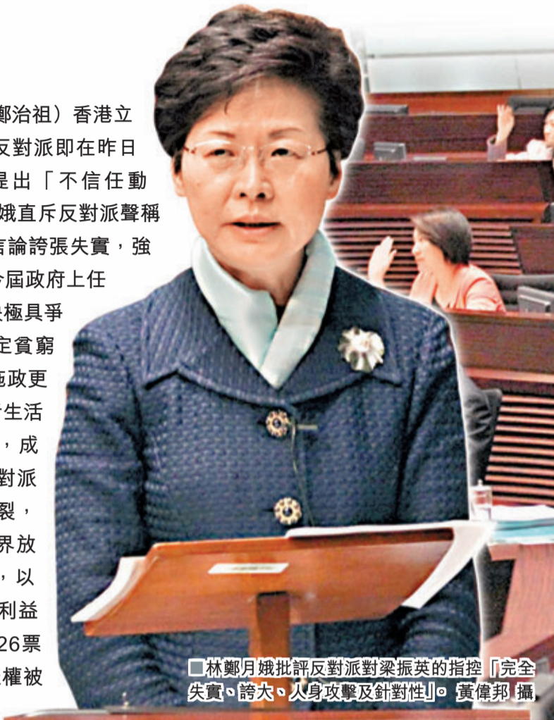
林鄭月娥批評反對派對梁振英的指控「完全失實、誇大、人身攻擊及針對性」。

香港文匯報訊(記者 鄭治祖)香港立法會復會僅僅兩星期，反對派即在昨日大會上向特首梁振英提出「不信任動議」。政務司司長林鄭月娥直斥反對派聲稱梁振英「撕裂社會」等言論誇張失實，強調在梁振英的領導下，今屆政府上任以來一直迎難而上，解決極具爭議的社會問題，包括制定貧窮線、長遠房屋策略等，施政更有所突破，包括推出長者生活津貼、「廣東計劃」等，成績有目共睹，並批評反對派的行為令社會不斷被撕裂，令她感到傷感，希望各界放下無謂爭拗，多做實事，以市民大眾的整體和長遠利益為依歸。最後，議案以26票贊成、32票反對、6票棄權被否決。