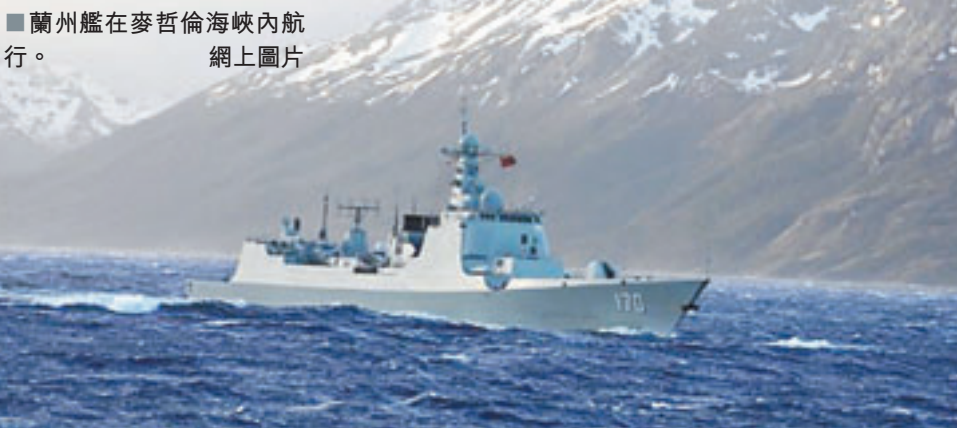
蘭州艦在麥哲倫海峽內航行。網上圖片