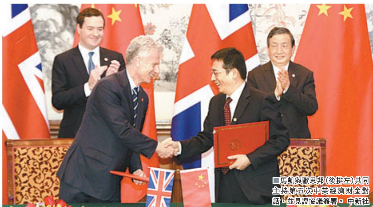
馬凱與歐思邦(後排左)共同主持第五次中英經濟財金對話,並見證協議簽署。

澳新銀行在一份報告中稱,「如今人民幣將在歐洲佔據更為穩固的一席之地。」周一歐思邦曾表示,「中國這樣的大國應當擁有一