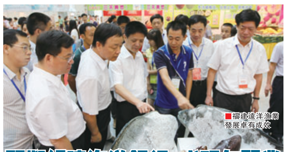
福建遠洋漁業發展卓有成效

麥哲倫海峽(Strait of Magellan),南美洲大陸南端和火地島、克拉倫斯島、聖伊內斯島之間的狹窄水道。因葡萄牙航海家麥哲倫於1520年首先由此通過進入太平洋,因此得名。峽灣曲折,長563公里,最窄處僅3.3公里,兩側岩岸陡峭,海峽內多大風暴,是世界上風浪最猛烈的水域之一,是溝通南大西洋和南太平洋的通道。