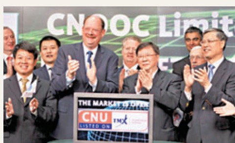
2013年9月18日，中國海洋石油在加拿大多倫多證券交易所掛牌交易。 資料圖片

上週五紐約12月期金收報1,268.20美元，較上日下跌28.70美元。現貨金價上週早段受制1,330美元附近阻力後，已持續偏弱，故此市場上週五預期美國債務上限僵局將會出現突破後，現貨金價曾進一步下挫至1,260美元附近的3個月低位。雖然現貨金價本週初受「債限談判破裂」而逐漸反彈至1,278美元附近，但美國國會週四「死線」的僵持局面依然是充滿不確定性下，金價的反彈幅度將會繼續受到限制，預料現貨金價將暫時上落於1,260至1,290美元之間。