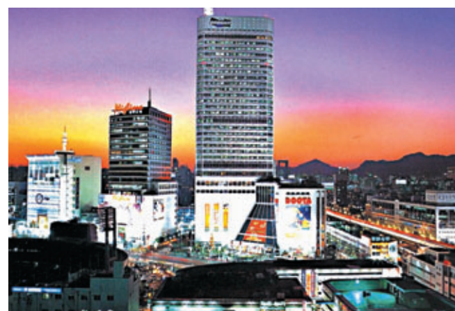
韓國首爾東大門市場，是韓國最大規模批發零售市場。市場內有20多個綜合購物大樓和3萬多個專門商店、5萬多家製造公司，是首爾的購物王國。 資料圖片

此外，上月韓國政府和企業估計整體發行國際債券量60億美元，有望創下去年1月以來新高，而10月起外資持續超買韓股，使得上月的這一波的超買金額已超過10萬億韓圓，顯示資金重返該國金融市場意願恢復，讓韓股後市表現具憧憬。