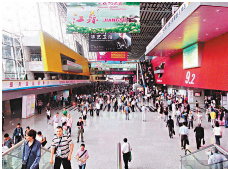
預計本屆廣交會到會境外採購商與上屆持平。

量,連續排名第一。不過,記者也注意到,近幾屆廣交會港商到會都有所下降,劉建軍稱,香港採購商佔廣交會到會採購商超一成,從近幾屆統計來看,來自香港的採購商有下降的跡象。他認為,中國加入WTO之後隨着市場的多元化,更多的境外採購商與會,香港採購商優勢地位有所下降。而隨着更熟悉廣