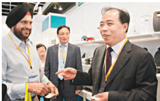
寧波代市長盧子躍向外國客商親自吹噓寧波產品。

香港文匯報訊(記者 白林森、潘恒)甬港一家親,今年再聚首。在昨日2013甬港經濟合作論壇新聞通報會透露,本屆論壇今起至17日在香港舉行,