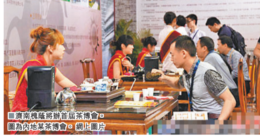
濟南槐蔭將辦首屆茶博會。圖為內地某茶博會。

香港文匯報訊(記者 何冉 濟南報導)記者日前從濟南(槐蔭)茶文化博覽會新聞發佈會上獲悉，首屆中國·濟南(槐蔭)茶文化博覽會將於10月18日至20日在濟南廣友茶城舉辦。據槐蔭區宣傳部長周敬介紹，本屆茶文化博覽會以「廣邀茶友聚泉城 共享多彩十藝節」為主題，宣傳茶文化、傳播茶知識，打造泉城市民親泉、品茗、悟道的茶文化盛宴。