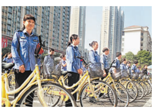
城管「騎士團」出動，以車代步低碳巡行。

香港文匯報訊(記者 董曉楠 長沙報導)近日記者獲悉，湖南長沙成立首支城管巡邏「騎士團」。值得一提的是，城管「騎士團」巡行時不僅可以以車代步，還能享受每兩個半天的「情緒假」，受了委屈可自行休息半天。在長沙雨花區左家塘街道，新成立的城管巡