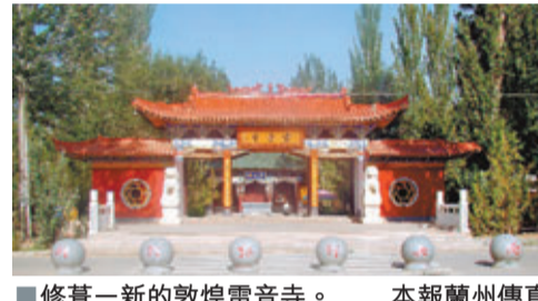
修葺一新的敦煌雷音寺。本報蘭州傳真

香港文匯報訊(記者 朱世強 蘭州報導)記者14日從甘肅省敦煌市民族宗教局獲悉，總投資1.5億元人民幣、佔地300畝的敦煌雷音寺經過三年大規模升級改造後，日前首次面向遊客開放。由於莫高窟不允許遊客燒香，此次「升級」後的雷音寺將成為敦煌境內規模最大、最重要的佛教活動場所。