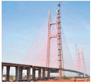
九江新長江大橋本月底通車。網上圖片

香港文匯報訊(記者 王道 綜合報導)據江西省交通部門消息，九江新長江大橋將於本月底建成通車，老橋將進行為期3年的封閉擴改建。九江新長江大橋全線雙向六車道，設計時速100公里，貫通了福銀高速的江西和湖北段。與之前的老橋的雙向兩車道相比，九江新長江大橋的通車將大大緩解過江交通壓力。