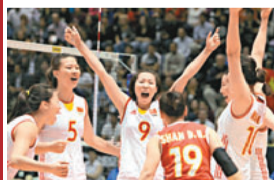
中國U23球員慶祝得分。

新華社墨西哥城11日電 在11日晚結束的首屆23歲以下(U23)世界女排錦標賽準決賽上，中國隊以3：0擊敗日本隊挺進決賽，將與戰勝美國隊的多米尼加隊爭奪冠軍。