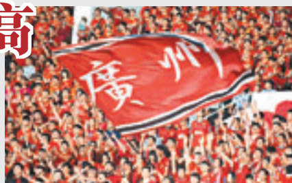
亞冠決賽恒大主場門票即將發售。

個不同版本的消息顯示，此次門票價格上下限約在400元至3000元人民幣之間。而來自對手韓國FC首爾的消息則稱，其主場門票價格將不超過200元，最低僅需50元。這也意味着，不管是最低票價還是最高票價，恒大主場門票價格將是對手的10倍以上。