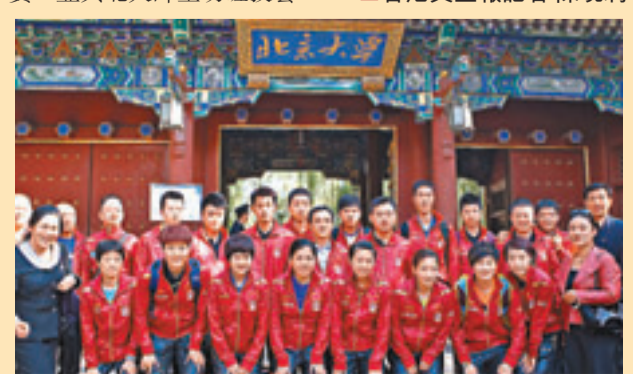
國乒在北京大學門前合影留念。

交流活動後，隊伍還在邱德拔體育館上演了精彩的表演賽，並與北大學子切磋技藝。 ■香港文匯報記者 陳曉莉