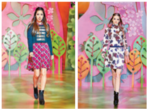
Marc by Marc Jacobs

在今次的時裝匯演中，模特兒穿上了多個時裝品牌的服裝，如7 For All Mankind、Alexandra Zouari Paris、ANTEPRIMA WIREBAG、AIX Armani Exchange、ARTÉ Madrid、ck Calvin Klein、DKNY、EVITA PERONI、Folli Follie、FURLA、GUESS、iBLUES、KOOKAI、Lancel、Marc by Marc Jacobs、Marella、Marks & Spencer、MAX & Co.、PANDORA、PENNYBLACK、Vivienne Tam及WEEKEND by MaxMara，一看之下，多個品牌皆以繽紛色彩為特色。