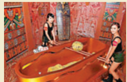
進入古墓之挑戰者需站於千年木乃伊靈柩兩旁，合力將木乃伊甩掉的頭部，於靈柩中將其與身體重新連接起來。