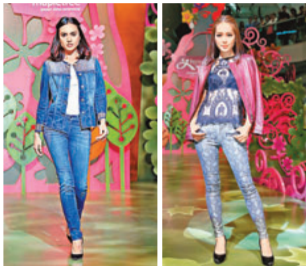
7 For All Mankind