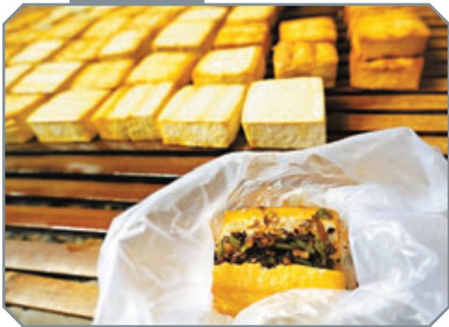
■備受遊客喜愛的煙熏豆腐。