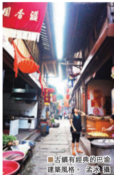
■古鎮有經典的巴渝建築風格。