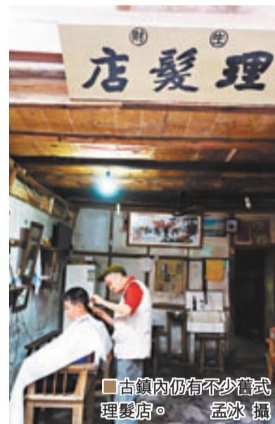
■古鎮內仍有不少舊式理髮店。

中山古鎮是一條長約1,500多米的古街道，以青石板鋪設的街面為軸，東西兩排而走，街面3至5米不等。兩側的店舖面樓上可住人，開間做得較大，且易組合；整座古鎮全用青色瓦片蓋頂，紅漆木板竹篾夾牆，圓柱承重，古樸凝重中透出原汁原味的巴渝人家風韻。歷經幾百年的雨打風吹後，長街很多地方已經衰敗，斷瓦殘簷間蛛塵密佈，古意森森。