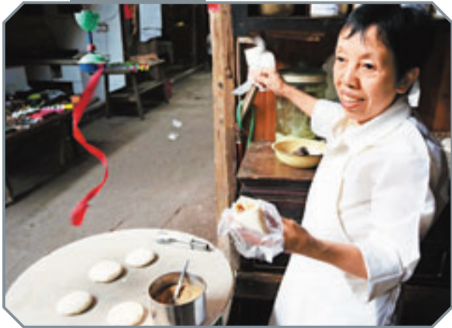
■「劉大姐石板糍粑」已有百年歷史。

如今，幾乎每天都有長途跋涉來參拜愛情天梯的遊客——雖然從中山古鎮來往天梯的車輛稀少，爬完6,000級階梯需要90多分鐘，且山路泥濘，坑坑窪窪，亦沒有任何服務配套設施。據了解，當地政府為了方便遊客，正在斥資打造「愛情天梯」旅遊專線。