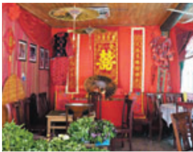
■古鎮處處貼着妙趣橫生的對聯。

古鎮裡最有名的風味小吃是「石板糍粑」和「煙熏豆腐」。「煙熏豆腐」就是將豆腐塊放在竹塊上煙熏後賣給遊人，店門上的對聯更是有趣——「熱心人盡辦熱心事；燙手貨不收燙