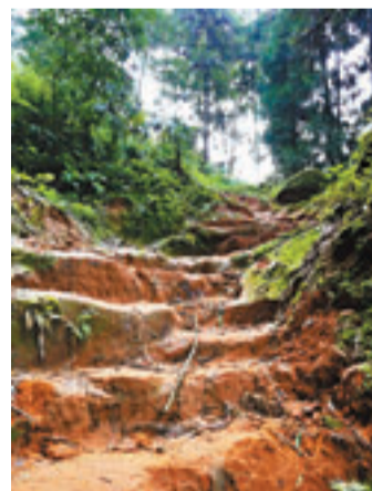
■愛情天梯吸引世界各地遊人。