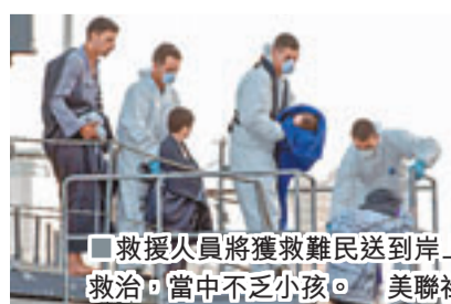
救援人員將獲救難民送到岸上救治，當中不乏小孩。

意大利南部拉姆培薩島附近海域再發生海難，一艘載了約250名非洲難民的船隻，前日在馬耳他對出110公里海域翻沉，馬耳他官方指最少27人死亡，包括3名兒童，暫有221人獲救。意國傳媒則稱目睹約50具屍體，包括10名兒童，初步懷疑船隻超載肇禍。