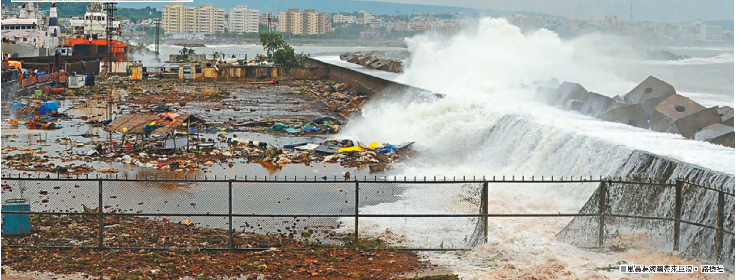
風暴為海灣帶來巨浪。路透社

呂宋布拉干省廣泛地區水浸，2名兒童和一名老人遭淹死。鄰近羅德里格省7個沿海村莊逾2,500人須緊急疏散。當地天文台估計，百合開始逐步減弱，首都馬尼拉未受威脅。 ■法新社/美聯社