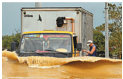
菲律賓水浸情況嚴重，水深達貨車一半高度。

颶風「百合」昨吹襲菲律賓北部地區，造成8人死亡，4人失蹤，逾200萬人斷電。百合挾著時速150公里的強風直撲主要產米區，當局初步估計1.5萬公頃稻田受破壞。呂宋中部37個城鎮斷電，約3,000人湧至政府臨時收容所避難。百合昨移向南海，最高風速為每小時120公里，對沿海地區仍具威脅。