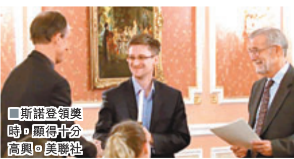
斯諾登領獎時，顯得十分高興。

「維基解密」網站前日刊登美國前中情局（CIA）職員斯諾登的6段講話片段，他批評華府針對全球電話和互聯網通訊的大規模監控行動，激發民眾與華府衝突的風險，而行動監視所有人的一舉一動，令人們感到不安全，且會損害美國及其經濟。