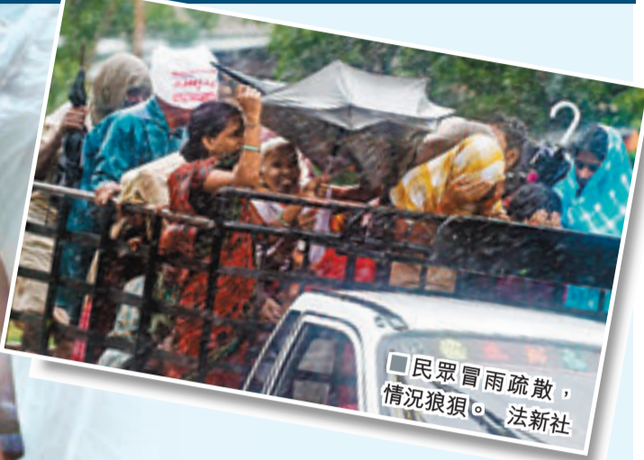
民眾冒雨疏散，情況狼狽。

超級風暴「費林」殺到，不少災民都到庇護中心避難，但當地傳媒揭發不少中心長期空置，日久失修。安得拉邦一名漁民表示，從不知道該處有一座1982年建成的庇護所，也從未見過有人使用。它現時出現許多巨大的裂縫，有倒塌之虞。 另有部分庇護中心被更改用途，成為警署、學校、政府辦公室，又或是被私人發展商佔用。有避難所曾被改建為學校，但學校搬遷後空置，成為反社會人士藏身之所。居民指出，當風暴吹襲時，建築物已不能用作避難。 ■《印度斯坦時報》/美聯社