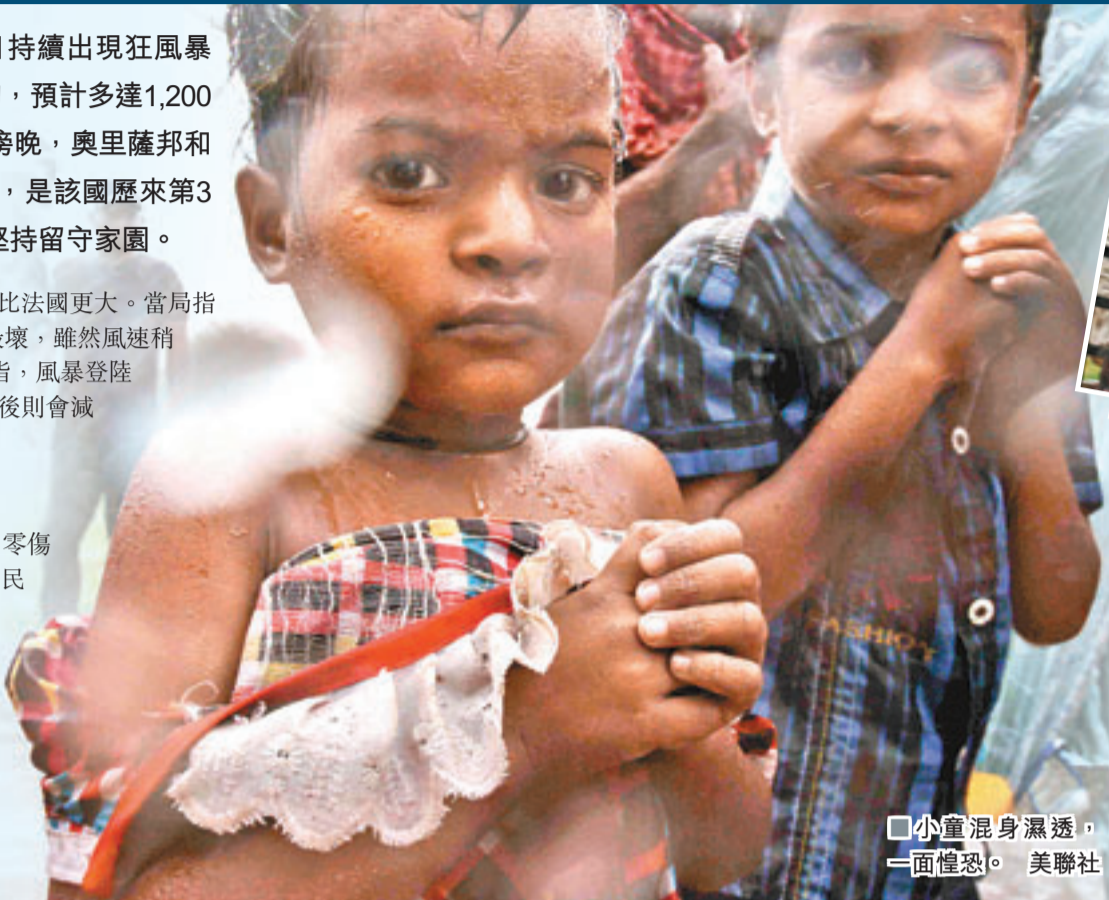
小童混身濕透，一面惶恐。