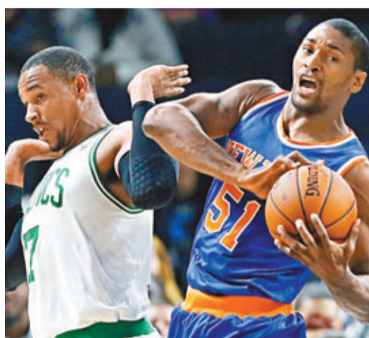
慈世平(右)力抗對手。

另外，前湖人球員慈世平昨日首次為紐約人在NBA季前賽上陣，結果他取得13分，協助球隊以103：102險勝塞爾特人。紐約人雖然在第三節完以79：65領先波士頓塞爾特人，但塞爾特人去到最後一節竟然狂追，幸好紐約人仍保勝局，以103：102贏波。紐約人下一場季前賽，將在明晨迎戰多倫多