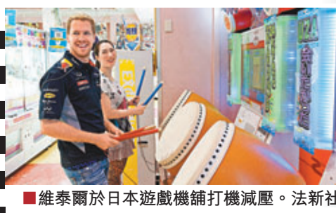
維泰爾於日本遊戲機舖打機減壓。

在展望本周的比賽時，維泰爾稱如果能夠提前衛冕車手總冠軍將是一件「幸事」：「我們的賽車目前看起來非常不錯，所以周末的比賽我們沒有理由跑不好，如果奪冠將是一件不可思議的事情。」歷史上只有方吉奧、舒麥加做到過車手4連冠，而維泰爾馬上就要成為第3個書寫此紀錄的人。香港文匯報記者 梁啟剛