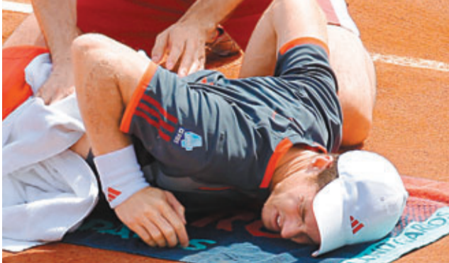
梅利今季受背傷困擾。資料圖片

英國網球名將梅利因傷於9日決定退出即將開始的ATP年終總決賽，這位倫敦奧運會網球男單冠軍的2013賽季征程就此提前結束。目前世界排名第3的梅利本賽季表現出色，與拿度、祖高域和費拿，提前鎖定了年終總決賽的席位。2012年起，梅利就受到腰傷的困擾，今年9月他剛剛動了手術，但是看來恢復情況並不理想。「我熱愛在家鄉球迷面前打球，但很遺憾，今年我不能參賽，我會竭盡全力明年再次入圍總決賽。」他說。2013賽季ATP年終總決賽將於11月在倫敦舉行。