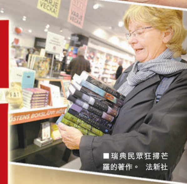
瑞典民眾狂掃芒羅的著作。

文學獎公布後，芒羅的女兒把母親從睡夢中喚醒，告訴得獎消息。現居於安大略省西南的克林頓鎮的芒羅受訪時表示，知道自己是獲青睞的候選人之一，惟沒想過真的能獲獎，高興之餘「受寵若驚」，坦言一直把獲諾獎視為「可能發生，但很可能不會成真的白日夢」。 瑞典學院前任秘書英格倫表示，短篇小說不及長篇大作般引人注意，但芒羅將短篇藝術發揮得淋漓盡致。她將獲得800萬瑞典克朗(約953萬港元)獎金。