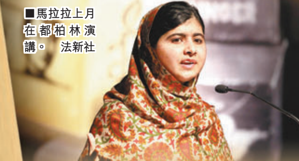
馬拉拉上月在柏林演講。 法新社

中謙虛地表示，自己在文學有成就，是因在其他領域無所長。她年輕時就讀西安大略大學，遇上首任丈夫詹姆斯，翌年輟學結婚並移居溫哥華，兩人育有三名女兒。 芒羅1972年離婚後，回母校西安大略大學擔任駐校作家，四年後與地理學家弗雷姆林再婚。 1977至1981年間，芒羅訪問中國和澳洲等全球多地。她的小說三度獲加拿大總督獎，包括步入文壇後的處女作、1968年出版的《快樂影子舞》。她其中一部著名