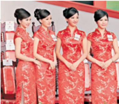
大學生擔任「雙十金鈞」，紅色旗袍添慶典喜氣。中央社