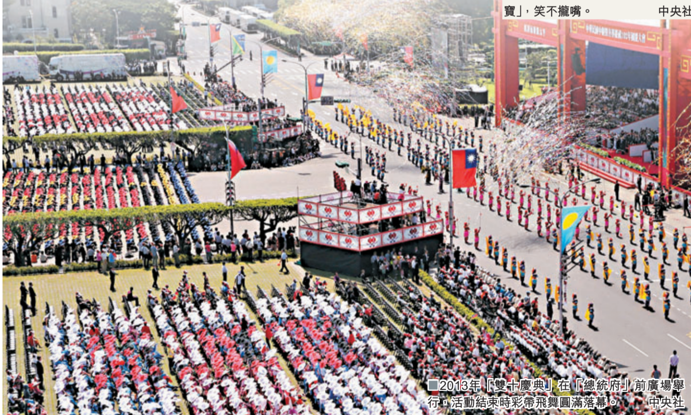
2013年「雙十慶典」在「總統府」前廣場舉行，活動結束時彩帶飛舞圓滿落幕。