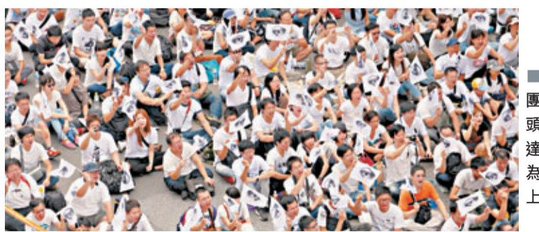
多個民間團體走上街頭抗議，表達訴求，圖為白衫軍再上街頭。

香港文匯報訊 綜合消息：「雙十」慶典除了場內熱鬧，場外氣氛也一樣是滾熱辣。包括「反核行動聯盟」、「公民1985行動聯盟」等多個民間抗議團體兵分多路，在慶典活動周邊會師後一同抗議表達訴求，其中有民眾要求馬英九應對諸多不當施政道歉下台。