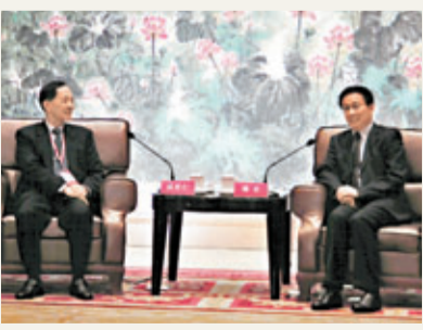
韓正(右)在「兩岸和平論壇」前會見高育仁(左)。

根據主辦單位資料，台方與會者除專研大陸問題的學者外，還包括「二十一世紀基金會」董事長高育仁、前行政機構副手吳榮義、前外交部門負責人程建人、前「陸委會」主委張京