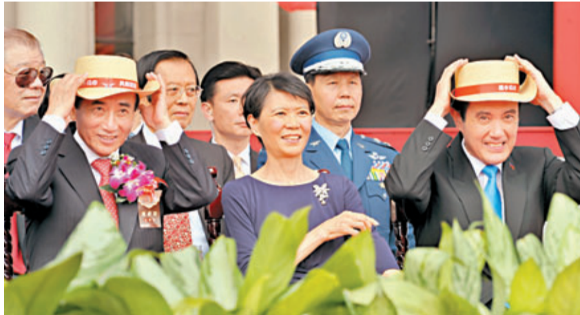
馬英九(前右)、王金平(前左)同一時間戴起大會帽子，活像兩個「大細路」。中央社

香港文匯報訊 據中央社報導，今年「雙十慶典」最搶鏡焦點是馬英九與「立法院長」王金平自司法關說案後首度同場出現，二人此前已超過1個月未有互動。媒體密切關注王金平進「總統府」迎接馬英九與夫人周美青進場及馬英九演說、回座觀賞表演節目過程，獵取馬王二人互動畫面。馬王二人昨日在大會上五度握手，隔著周美青笑臉交談，一起戴上草帽，看起來與老友無異。