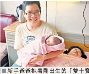
新手爸爸抱着剛出生的「雙十寶寶」，笑不攏嘴。