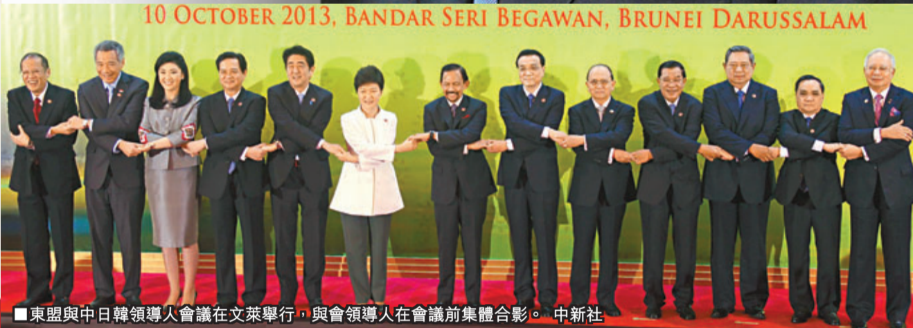
東盟與中日韓領導人會議在文萊舉行，與會領導人在會議前集體合影。