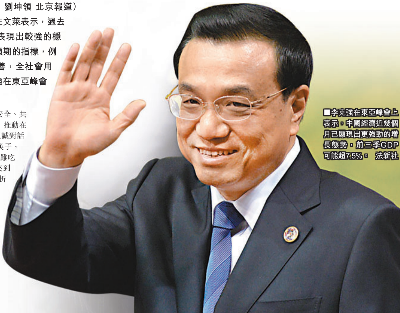
李克強在東亞峰會上表示，中國經濟近幾個月已顯現出更強勁的增長態勢，前三季GDP可能超7.5%。

李克強表示，每個峰會成員國對地區的安全穩定都負有責任，希望和平之光永遠普照東亞大地，讓東亞永享穩定安寧。