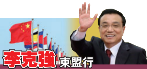
李克強在東亞峰會上揮手致意。