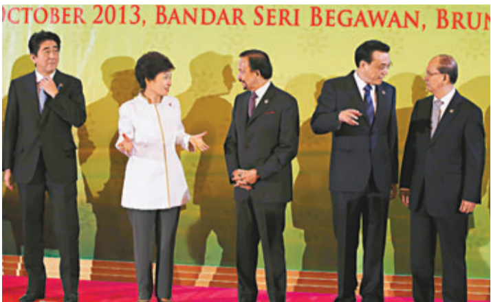
在大合照前，李克強及朴槿惠忙與其他領導人交談，對安倍晉三視而不見。