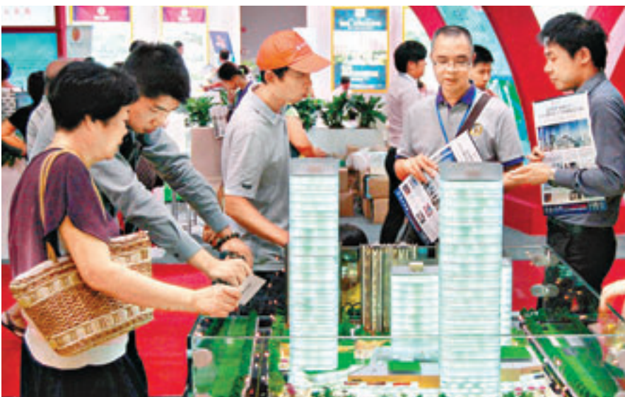
廣州大部分新開樓盤採用「陰陽合同」,網簽成交均價已缺乏參考意義。

時要求簽訂每平米2,500元至3,500元不等的裝修合同,這樣樓盤實際上單價已過萬元。有開發商銷售時也稱,目前樓市銷售不錯,公司並沒有計劃在今年降