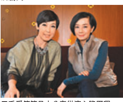
毛舜筠節目中分享從演心路歷程。

香港文匯報訊 由黎芷珊主持的《最佳女主角》邀得毛舜筠擔任嘉賓，毛舜筠與張國榮合演的電影《家有喜事》刷新了1992年的香港票房紀錄，2006年憑《早熟》奪得第25屆香港電影金像獎最佳女配角。提及入行經過，原來毛舜筠的父母都是擔任電視台幕後工作，有一次監製找新主持，想起毛Uncle有一個古靈精怪的女兒，便邀請她來面試。毛Uncle本來怕她面試失敗而不讓她去，不過後來也讓她面試。之後工作人員竟然漏了通知她進行面試，不過最後監製還是選了有參與複試的她，連毛Uncle也覺得很威！