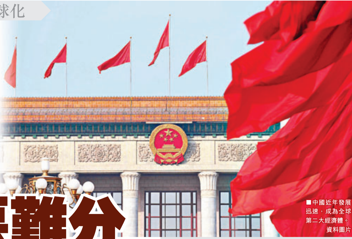
■中國近年發展迅速，成為全球第二大經濟體。

國際磨合 中國自1978年改革開放，積極發展經濟，從一個積弱百年的國家，一躍成為現今世界第二大經濟體系，成績有目共睹。中國經濟騰飛的同時，於國際社會間的話語權亦逐漸增加，更積極地參與國際事務，其影響擴展到東南亞、中東、非洲等國家，成為發展中國家的龍頭。由於中國奉行前領導人鄧小平的「韜光養晦」外交政策，往往予以外國一種深藏不露的印象，甚至有西方國家提出「中國威脅論」，認為中國的極速發展威脅國際社會的權力平衡。而在全球化的大趨勢下，中國與國際社會的交流更頻繁，包括經濟、貿易、文化等，同時也加劇雙方的矛盾。去年，美國總統奧巴馬成功連任，制訂「重返亞洲」外交策略，並率先簽訂《跨太平洋戰略經濟夥伴關係協定》(英文簡稱TPP)，試圖從經濟和政治兩大層面圍堵中國。下文將介紹TPP的內容及分析背後反映的全球化現象，並會探討中國應否加入此協定，以擴大國際社會的話語權。 ■黃德正 中學通識教育科教師