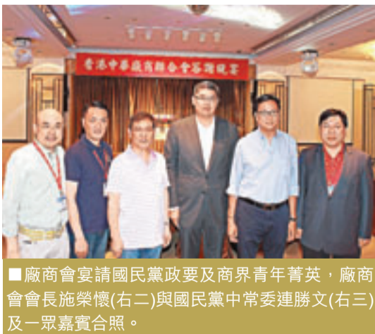
■廠商會宴請國民黨政要及商界青年菁英，廠商會會長施榮懷(右二)與國民黨中常委連勝文(右三)及一眾嘉賓合照。