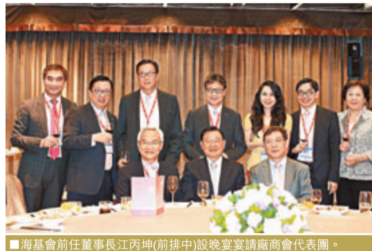
■海基會前任董事長江丙坤(前排中)設晚宴款待廠商會代表團。