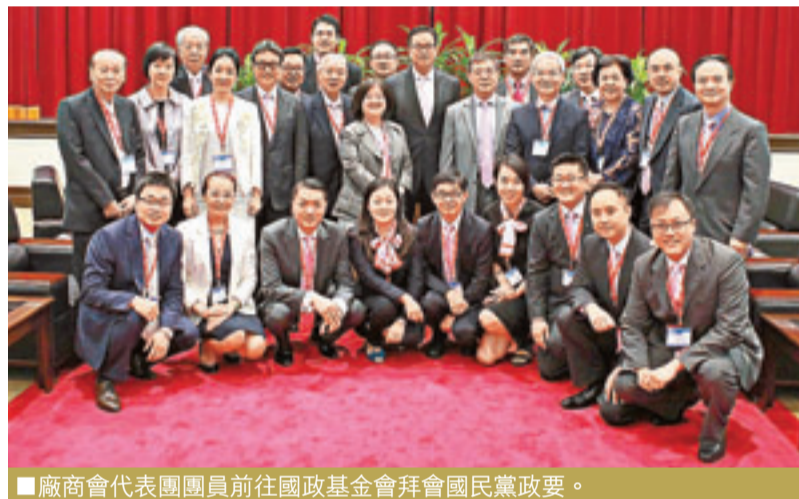
■廠商會代表團團員前往國政基金會拜會國民黨政要。