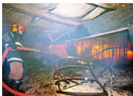
消防員不停向火場射水。

孟加拉首都達卡郊區一間為多個國際著名品牌生產成衣的製衣廠前晚發生大火，造成至少10死約50傷。由於現場缺乏水源，阻礙灌救，消防員花了10小時才控制火勢。當局正調查起火原因，初步相信是一部針織機故障起火所致。