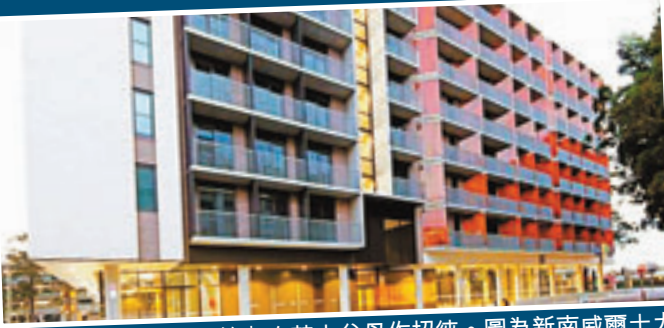
校方以「零酒精嚴管」向華人父母作招徠。圖為新南威爾士大學新建學生宿舍。

多年來，澳洲大學比美國大學更受中國學生歡迎，但近年華生赴澳留學人數開始下跌，去年赴美的中國留學生比赴澳更多。