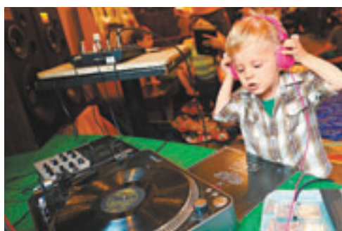
B仔戴起大耳筒，DJ上身。法新社