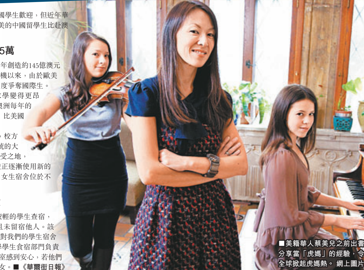
美籍華人蔡美兒之前出書分享「虎媽」的經驗，令全球掀起虎媽熱。

悉尼的新南威爾士大學晚上會對年紀較輕的學生查宿，以確保他們在晚上10時前回到宿舍，並且未留宿他人。該校商貿專業一名22歲福州學生說：「我媽對我們的學生宿舍有全天24小時校園安保感到滿意。」大學學生食宿部門負責人馬克斯說，家長確實對有這樣一個辦公室感到安心，若他們有要求，校方或許還能幫助監督他們的子女。■《華爾街日報》