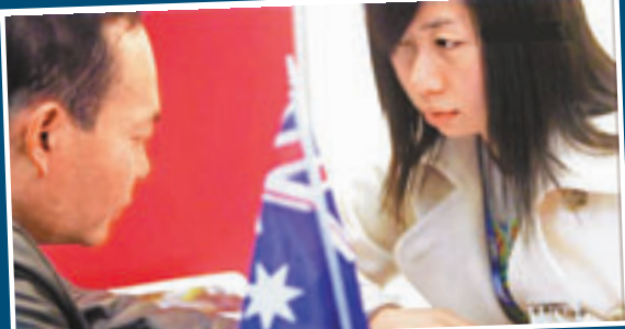
澳洲不少大學都到中國教育博覽會，吸引華人學生。

澳洲曾是中國學生最熱門的留學地點，但近年被生活和學習成本更低的美國大學搶走不少外國留學生。為留住學生，澳洲的大學開始向亞洲「虎媽」學習，尤其在學生宿舍的設計及入住守則上，更刻意滿足亞洲學生家長的嚴厲要求。