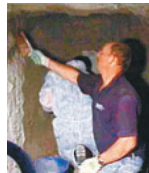
北極熊母親在洞穴中照顧兩隻幼熊的片段，原來在動物園內搭景拍攝。網上圖片