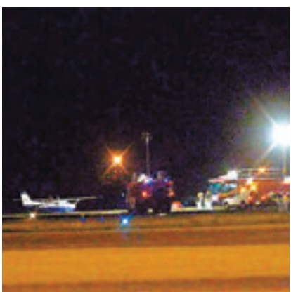
飛機成功急降機場，但機師其後證實死亡。