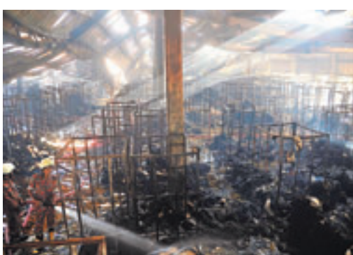
工廠只燒剩大量鐵架。

大火發生在首都達卡北部斯里布爾的Aswad Knit Composite製衣廠，該幢兩層高廠房嚴重焚毀，波及附近兩棟建築物，部分廠房昨日仍冒煙。據在現場發現的工廠訂單簿，該廠客戶包括美國品牌Gap、英國零售商Next、瑞典的H&M及法國超市集團樂福等。