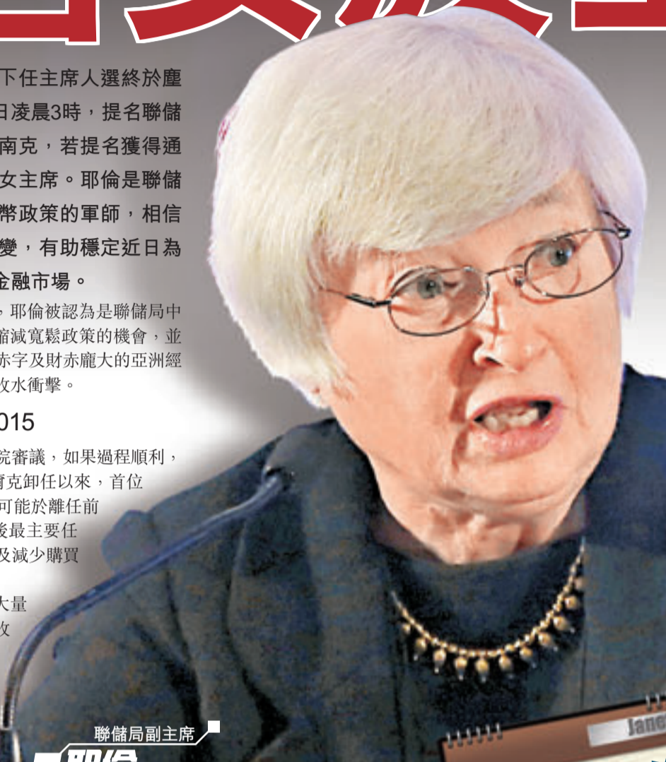
聯儲局副主席 耶倫