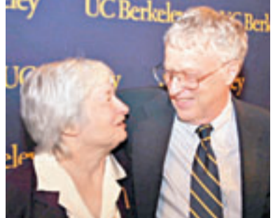
耶倫與丈夫阿克洛夫1977年在聯儲局一次午餐中認識，兩人惺惺相惜，蜜運不足一年便決定結婚。

夫婦倆不時會和其他學者聯手進行研究，後期研究集中探討貧窮及政策問題，包括失業率及未婚生子的社會成本等。