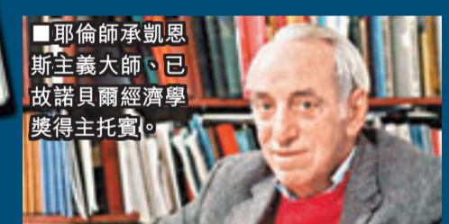
耶倫師承凱恩斯主義大師、已故諾貝爾經濟學獎得主托賓。