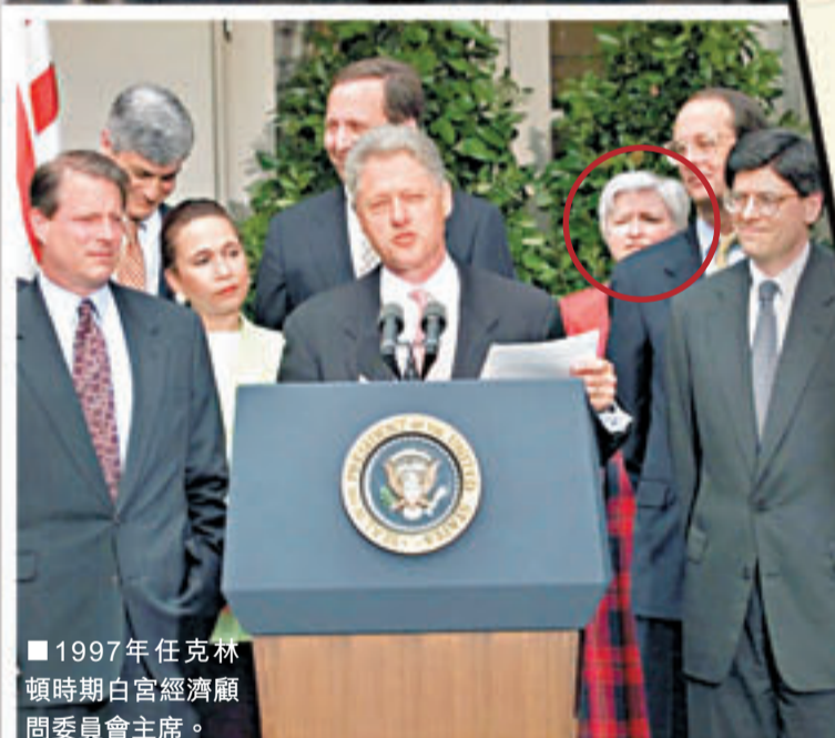
1997年任克林頓時期白宮經濟顧問委員會主席。