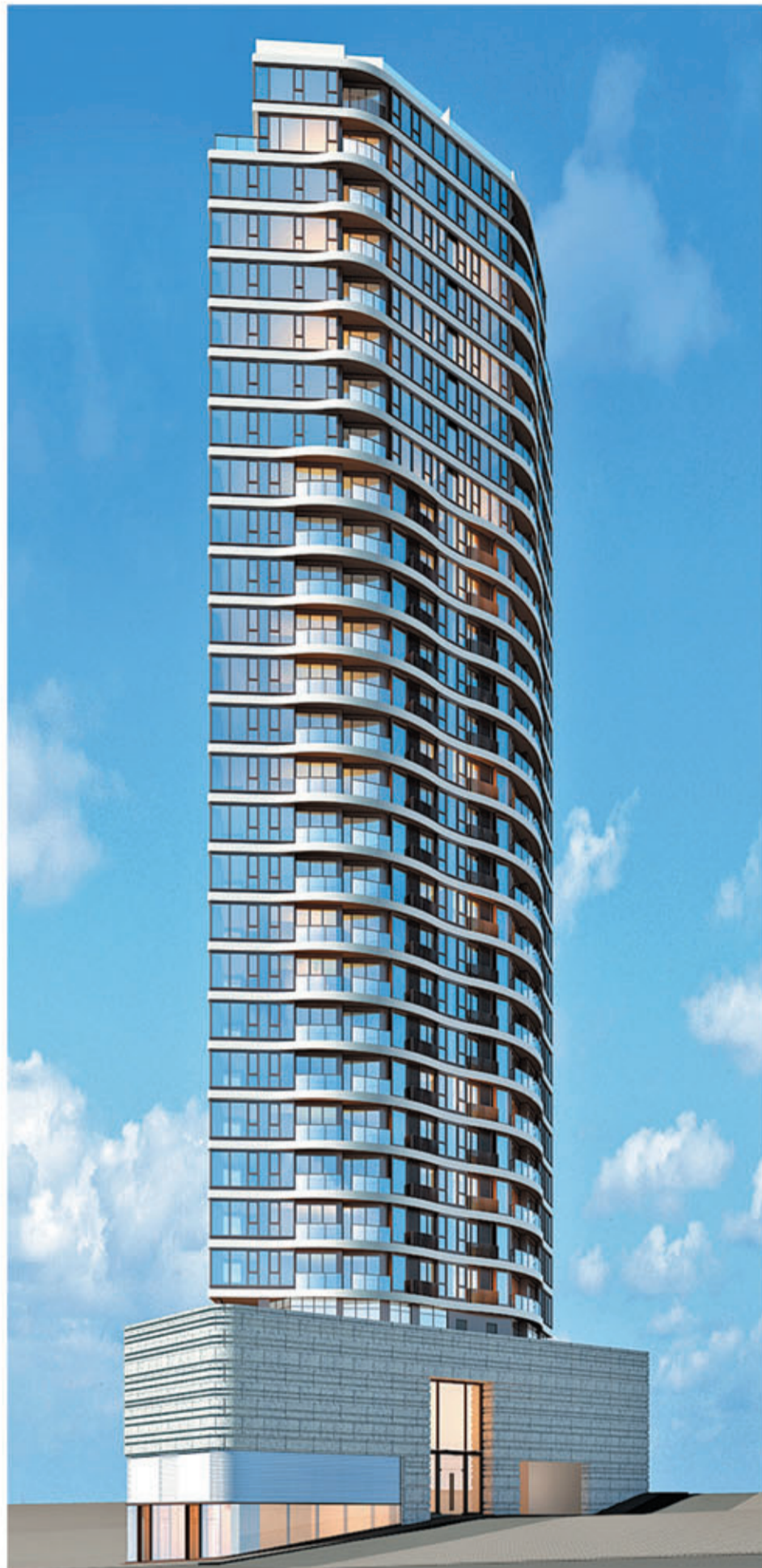
■ 罕有的絲帶式設計仿如將每個樓層以輕盈柔美的絲帶一環一環圍繞着，一圈一圈地伸延上雲霄，賦予「壹鑾」流線躍動的大都會活力，時尚氣息叫人耳目一新。(「壹鑾」設計概念圖)