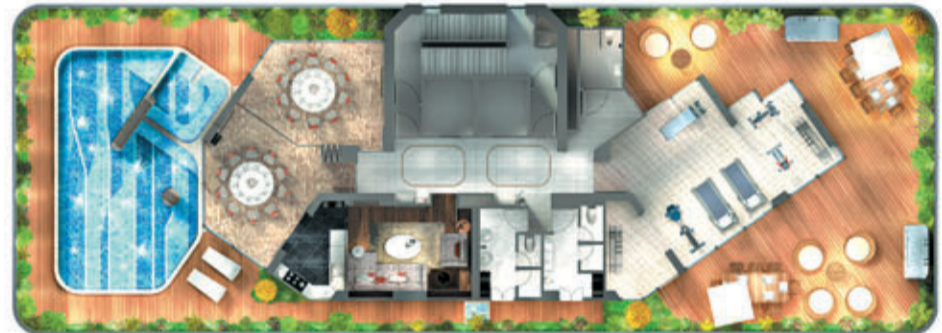
■ 「壹鑾」的住客會所包括室外游泳池、健身室、多功能廳、宴會廳及燒烤庭園。(住客會所設施層設計概念圖)