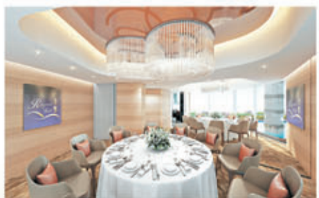
■ 宴會廳適合舉行各類活動，環境一流。(宴會廳設計概念圖)