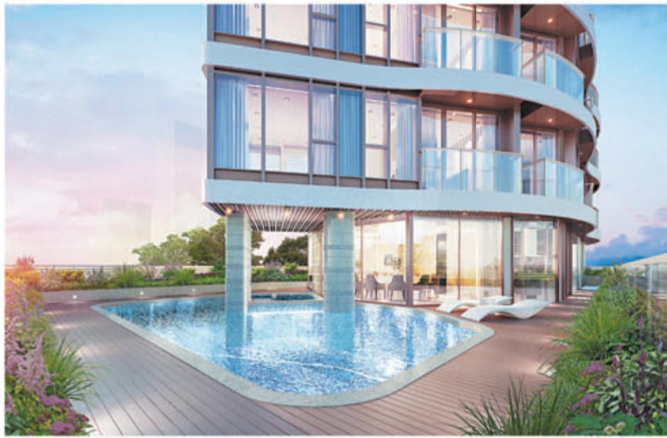
■ 住客會所備有室外游泳池，生活品味勝人一籌。(室外泳池設計概念圖)