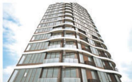
■ 絲帶用鋁板為飾面，放在每層的窗間牆，為下一樓層提供遮陽的功能。(「壹鑾」設計概念圖)