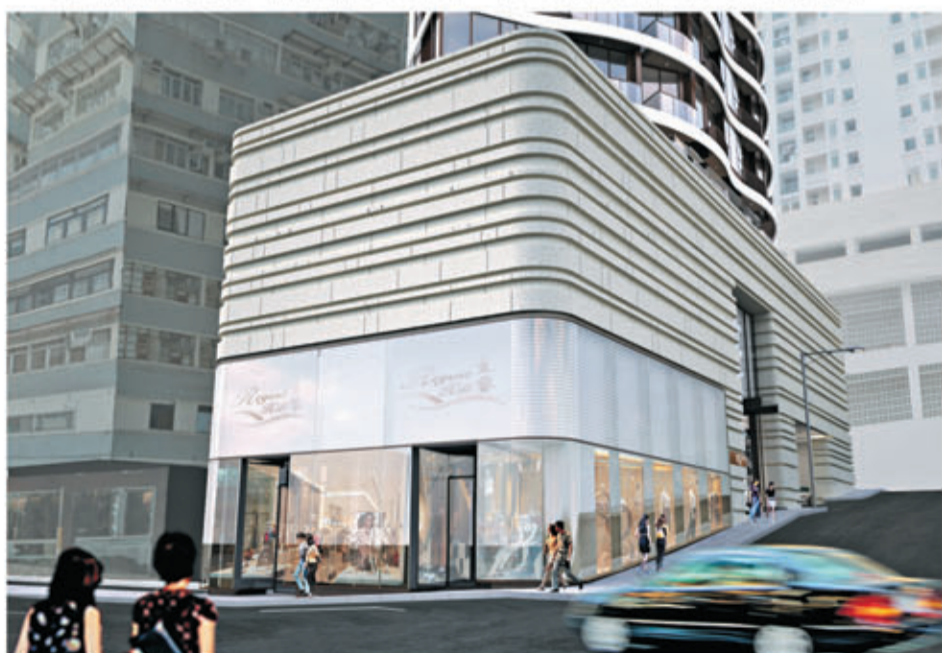
■ 大廈商舖眾多，為住客帶來生活便利。(大廈商舖入口設計概念圖)

現代化設計，展現住客的獨特品味，而且用料上乘，廚房配備MIELE和SIEMENS品牌用具，一、二房單位的開放式廚房牆身特別配上防指紋的黑色不銹鋼，時尚大方。房內備有Panasonic的冷暖空調、浴室提供Panasonic浴室寶，加上Samsung指紋辨識門鎖系統，大大提高保安程度。「壹鑾」從外到內一絲不苟，力求完美，全力打造「以壹為首」的帝皇之殿，彰顯住客的非凡身份，是尊尚貴族至為匹配的豪宅府邸。