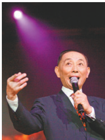
京劇大師梅葆玖壓軸登場。