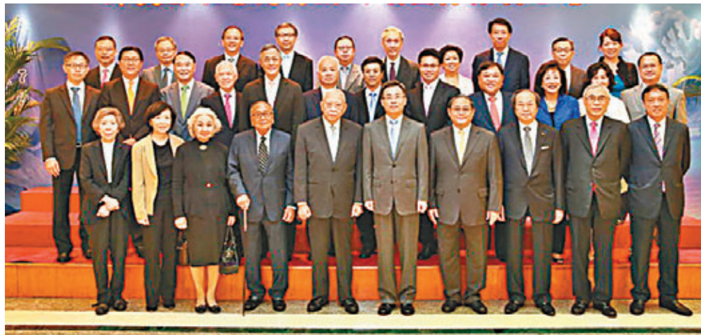
宋哲昨日和董建華率領的中美交流基金會舉行午餐會。

香港文匯報訊(記者 鄭治祖)外交部駐港特派員宋哲昨日為中美交流基金會主要成員舉行午餐會。在午餐會前，宋哲和全國政協副主席、中美交流基金會主席董建華會面。