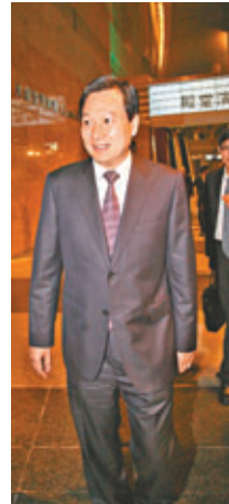
中聯辦副主任林武赴會。