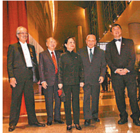
董建華伉儷(左三、左四)出席中大50周年晚宴。