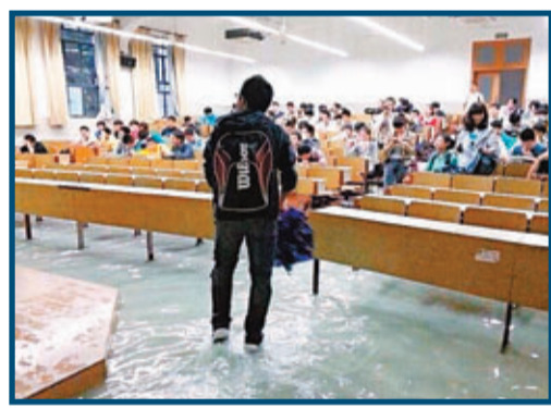
同濟大學學生在水中上課。網上圖片