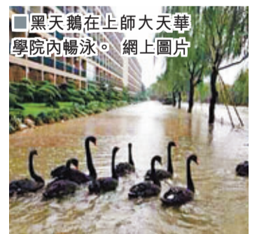
黑天鵝在上師大天華學院內暢泳。

位於嘉定區上師大天華學院的師生昨早驚奇地發現，校園操場被雨水淹沒後竟然引來黑天鵝一家，天鵝夫婦帶着一群小天鵝在校園暢游。由於水已漫至宿舍一樓窗台，同樣對人類感到好奇的黑天鵝時不時的把脖子伸進宿舍的窗口張望。