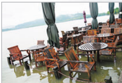
杭州西湖邊一家餐廳的桌椅被淹沒。

寧波市市區內澇嚴重且持續多時，為緩解交通困難，市區各單位9日一天停止上班，4個行政區的中小學、幼兒園亦停課1天。