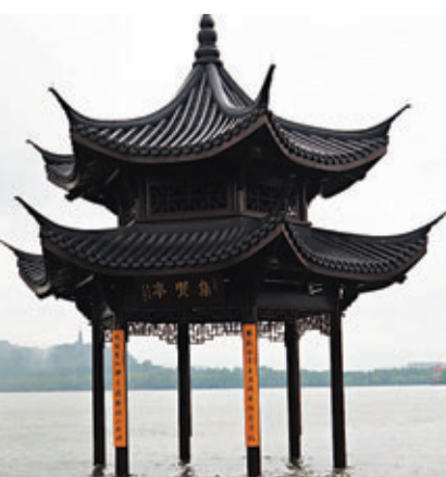
通道被淹，杭州集賢亭成為西湖上的「孤亭」。