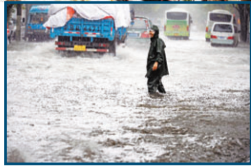
一名男子在上海市楊樹浦路積水路段涉水而行。

港口方面也受到影響，長江口部分航線8日封閉，崇明口岸原定出入口的國際航行船舶全部推遲或取消計劃。從當日凌晨起，外高橋港區亦有37艘國際航船取消進出港計劃。