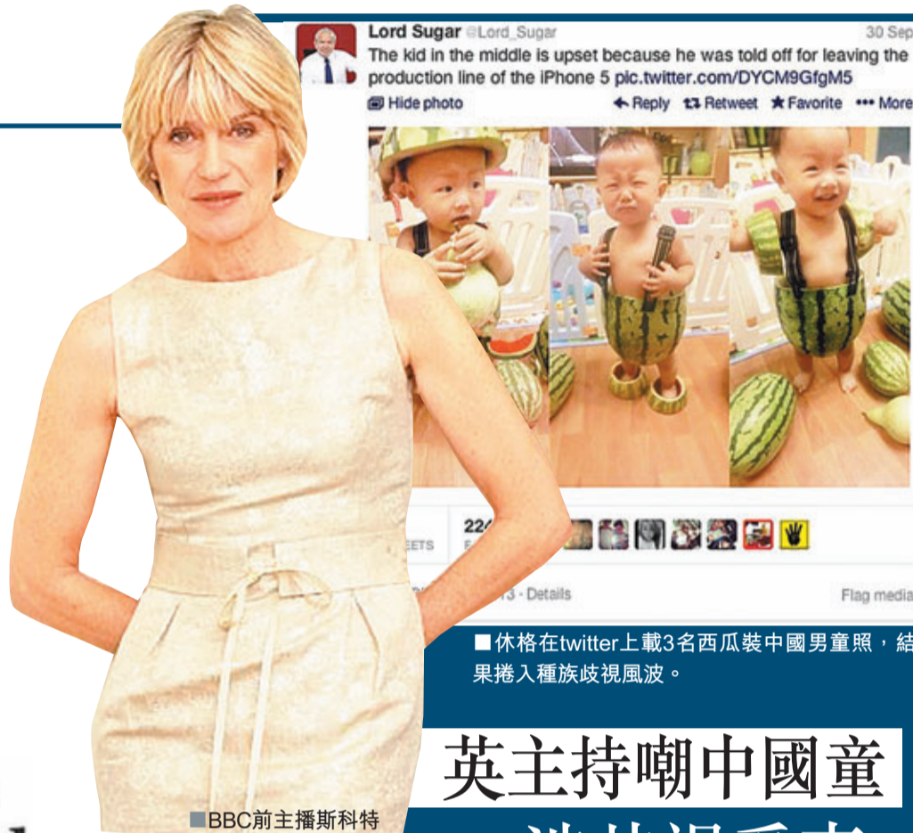
休格在twitter上載3名西瓜裝中國男童照，結果捲入種族歧視風波。