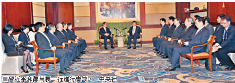
■習近平和蕭萬長一行進行會談。

香港文匯報訊 台灣中央社報道稱，昨天在印尼峇里舉行的「習蕭會」及張志軍和王郁琦歷史性互動，是兩岸開啟雙方接觸的新階段。