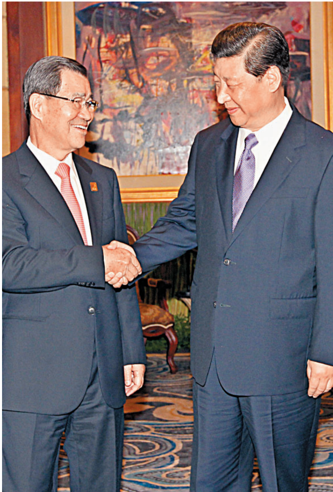
■習近平昨日在峇里會見蕭萬長。