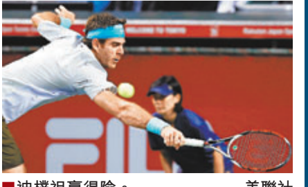
迪樸祖贏得險。

阿根廷男網球手迪樸祖昨日在日本公開賽4強,以直落2盤7:6力退西班牙球手艾馬高晉級,決賽將大戰3號種子的加拿大球手拉奧歷,後者在另一場4強賽以7:6和6:1的盤數擊敗羅馬尼亞球手杜迪。 香港文匯報記者 蔡明亮