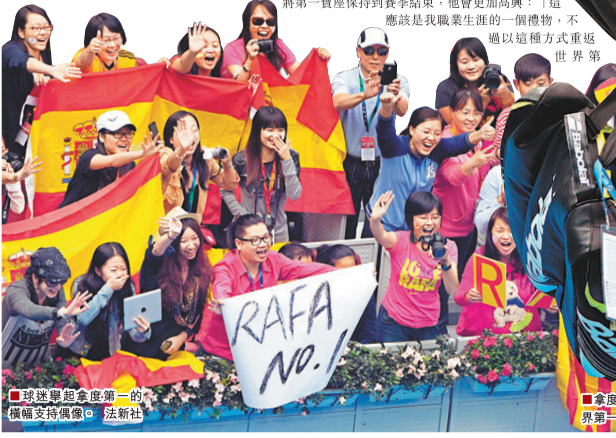
球迷舉起拿度第一的橫幅支持偶像。

中網女單頭號種子莎蓮娜威廉絲(細威)昨日在準決賽克服腰傷,以直落2盤6:2淘汰波蘭球手拉雲絲卡,躋身決賽,今日將與前世界第一姐、塞爾維亞球手贊高域爭奪冠軍。