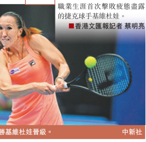
贊高域反勝基維杜娃晉級。

細威贊高域爭后冠 細威在首盤展示驚人的攻擊力,輕鬆以6:2先下一城。戰至第2盤,拉雲絲卡充分利用放短球、上網和挑高球的組合戰術調動細威,但戰術未見奏效,雖然細威因腰傷不適申請醫療暫停,但回到賽場後狀態不減,最終連下5局,以直落2盤6:2擊敗對手,錄得對賽7連勝,時隔9年再度闖入中網決賽,將與08年冠軍贊高域爭奪女單后冠。