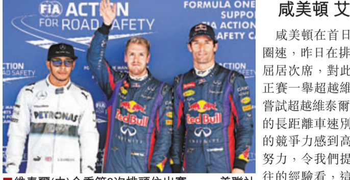
維泰爾(中)今季第8次排頭位出賽。

紅牛車手維泰爾昨日在韓國站排位賽做出最快圈速1分37秒202,今季第8次獲得排頭位出賽,緊隨其後的平治車手威美頓及起步表現特佳的法拉利車手艾朗素,賽後齊聲表示力爭超越維泰爾,圖阻對手贏得今站冠軍。(now671及672台今日2:00p.m.直播)