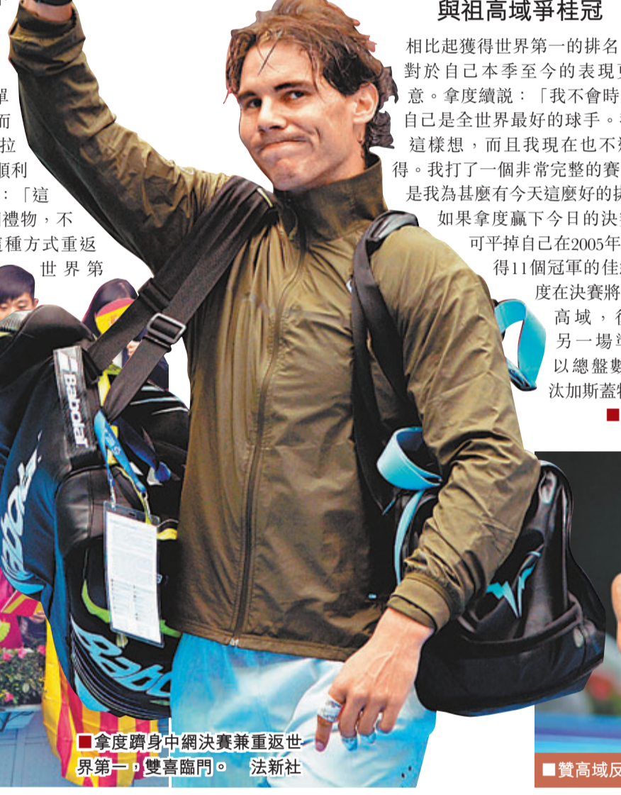
拿度躋身中網決賽重返世界第一,雙喜臨門。

細威贊高域爭后冠 細威在首盤展示驚人的攻擊力,輕鬆以6:2先下一城。戰至第2盤,拉雲絲卡充分利用放短球、上網和挑高球的組合戰術調動細威,但戰術未見奏效,雖然細威因腰傷不適申請醫療暫停,但回到賽場後狀態不減,最終連下5局,以直落2盤6:2擊敗對手,錄得對賽7連勝,時隔9年再度闖入中網決賽,將與08年冠軍贊高域爭奪女單后冠。