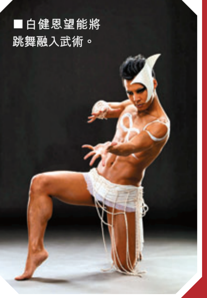
■白健恩望能將跳舞融入武術。