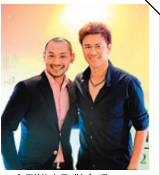
■金剛邀李聖傑合照。

香港文匯報訊 澳門英皇娛樂酒店日前舉辦「英皇宮殿2013國慶貴賓晚宴」，出席賓客近200名，大會更特別邀得台灣歌星李聖傑及羅敏莊擔任表演嘉賓，搞笑能手金剛擔任晚宴主持，三人以一首《愛拼才會贏》揭開晚宴序幕，全場賓客非常投入，不少人更一同和唱。 憑多首金曲風靡台灣的李聖傑，獻唱多首經典情歌如《癡心絕對》、《關於妳的歌》等，台下賓客聽得如癡如醉，連金剛也被李聖傑的歌聲感動，化身為小粉絲，在晚宴上要求合照。