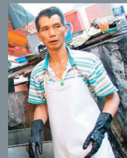
陳先生擔心，難免因未能供貨須違約，估計須賠償數十萬元。