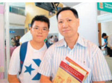
中學教師鄭先生(右)期望兒子(左)在港就讀醫科。

任職中學數學科教師的鄭先生，昨日一早帶同兒子到來。他表示，有意讓今年就讀中三兒子未來在本港就讀醫科，又指心儀港大醫學院。鄭先生認為，本港醫科專業訓練不俗，對子女成長發展有幫助。兒子則表示，向來喜歡科學，因此對讀醫科感興趣。