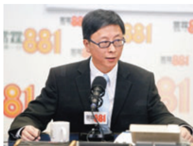
何栢良期望院方展開大型篩查工作後，疫情於1個月至2個月內受控。