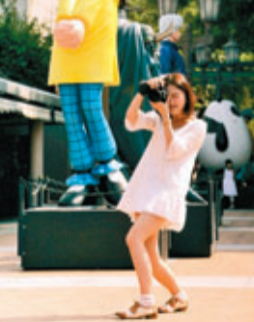
少女在「老夫子」公仔星光大道上拍照。

香港文匯報訊(記者 王維實) 為了慶祝「香港漫畫星光大道」開放一周年，香港動漫畫聯會昨日於九龍公園廣場舉辦「香港漫畫星光大道一周年同樂日」，現場設立多個漫畫工作坊，讓市民及旅客對漫畫製作有更深入了解。「香港漫畫星光大道」至今已