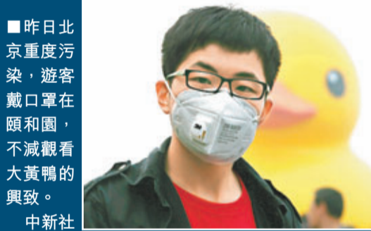
昨日北京重度污染，遊客戴口罩在頤和園，不減觀看大黃鴨的興致。