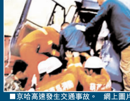
京哈高速發生交通事故。