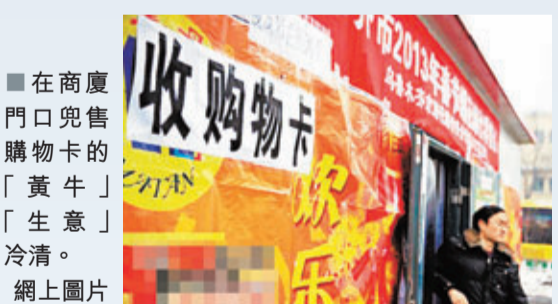
在商廈門口兜售購物卡的「黃牛」「生意」冷清。

在往年，很多機關、事業單位和國有企業發購物卡當過節福利，幾乎成爲不成文的規矩，一些員工把卡低價賣出套現，因而成就了「黃牛」在節日前後大量出現。不過眼下的「黃牛」們普遍反映，今年的生意不好做了，不僅卡不好收，卡的主流面值也大幅降低，往年面額1000元、2000元的卡很多，而今年三五百元的卡比較多。