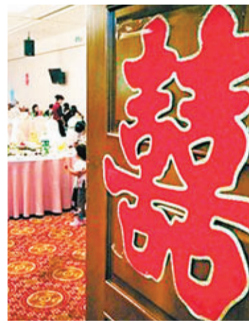
北京一所飯店昨日正在舉行婚宴。