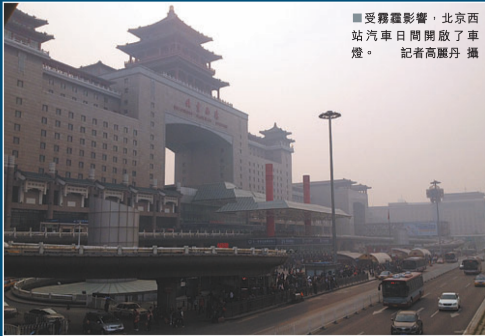
受霧霾影響，北京西門外西便門大街，昨日汽車日間開啟了車燈。

香港文匯報訊(記者 王珏 北京報道)往年秋高氣爽、晴空萬里的「十·一」黃金周，今年卻陷入「十面霾伏」。昨日華北、黃淮等地出現霧霾天氣，其中北京PM2.5濃度達到重度污染，能見度差。預計未來三天，該區域霧霾天氣持續至周一(7日)。氣象專家稱，北京十月上旬出現霧霾天史上罕見，這與近日的氣象條件及北京獨特地形因素有關，亦是多年來高排放的不良發展方式積累所致。