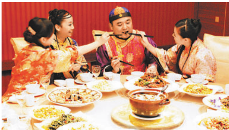
「十·一」黃金周期間，湖南懷化洪江古商城景區借旅遊文化周別出心裁推出了「少爺待客菜」、「小姐養生菜」、「老爺私房菜」系列菜餚。這些菜餚一亮相，立刻引來眾多遊客品嚐。

該項調查的受訪者人數100人，包括公務員、企業主、在京打工者和企業職員等，其中86人表示收到請柬，而祝福方式則是送禮金。受訪者中，55%的人送的禮金在500元以上，45%則只能付500元以下。此外，調查數據顯示，「紅色炸彈」讓59%的受訪者感受經濟壓力，其中30%的受訪者直呼「壓力很大，吃不消」。