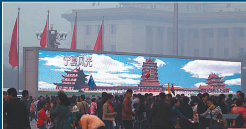
天安門的景致也被霧霾掩蓋。

另外，據央視報道，昨日早上京哈高速興城段出現大霧，瀋陽方向395公里處發生多輛車連環追尾事故，傷亡人數正在統計，事故導致堵車超10公里。事故路段相反方向也發生4車連撞，有人員受傷。