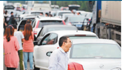
黃金周在四川成都雅高速擁堵路段，人們在等待通車。

「十·一」黃金周，晴空白雲的好天氣持續不久，從4日起，北京便開始陷入「霧霾圍城」，特別是5日，污染級別從前一天的輕度污染「兩級跳」，達到嚴重污染，全市35個監測站中，大半監測站的污染水平達到六級嚴重污染。京城整日都被霧霾籠罩，能見度低，不少北京市民及外來遊客也感覺呼吸不暢。