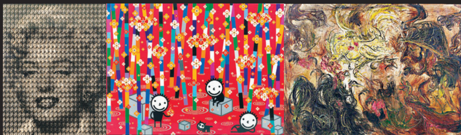
■金東園《瑪麗蓮對肯尼迪》 ■權奇秀《紅色森林》 ■藝術家Affandi的作品《Cock Fight》

作為上海龍美術館自開館以來首次主辦的國際性藝術館藏展，「亞洲線索」秉承美術館收集、梳理、研究、推廣和價值建構的尺度，以全新的視角呈現龍美術館獨特的亞洲當代藝術收藏。展覽由策展人、批評家黃篤策劃，聚焦來自日本、韓國、印尼和台灣的30位藝術家，展出包括繪畫、雕塑、攝影、影像、裝置藝術在內的40多件作品。 ■文、圖：香港文匯報記者 徐全