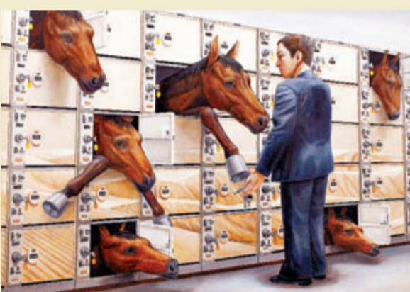
■石田徹也《野生》布面油彩

龍美術館負責人表示，在當代語境裡，不論是文化還是藝術，亞洲已經成為愈來愈備受關注的對象。亞洲藝術由於各國文化傳統以及政治、經濟模式和社會習俗的差異與共性，既呈現出各自不同的當代性，又有某種超越地緣因素的協調性，而當這些藝術作品被放在同一個空間裡展示的時候，便會產生很多有趣的碰撞與對比。美術館希望為觀眾呈現一個豐富、多元化，同時又不失學術性的亞洲當代藝術收藏展，以此來梳理、研究和推廣館藏的亞洲當