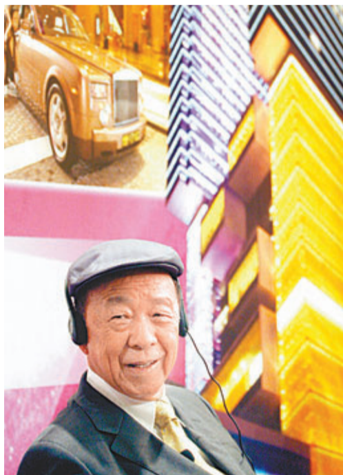
■受惠澳門博彩業，呂志和成為亞洲第二富。資料圖片

香港文匯報訊(記者 黃嘉銘)受惠澳門博彩業，濠賭股銀河娛樂(0027)股價近期屢創新高，除成為今年藍籌「股王」外，亦帶挈公司創辦人兼主席呂志和身家暴漲至1,724億港元，一舉超越四叔李兆基、彤叔鄭裕彤及新地郭氏家族，成為亞洲第二富，僅少過亞洲首富超人李嘉誠68億美元，成為名副其實的「賭王」。