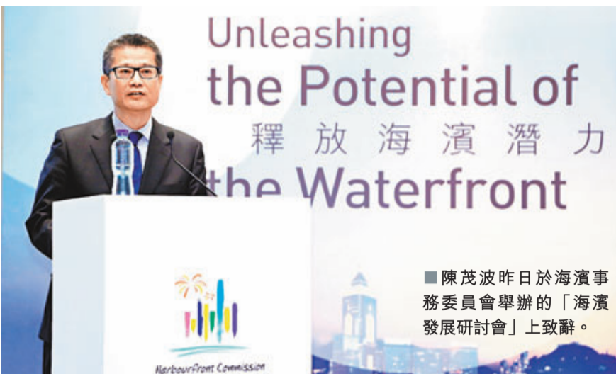
■ 陳茂波昨日於海濱事務委員會舉辦的「海濱發展研討會」上致辭。

他續說，儘管未有開放的具體時間表及細節，但特區政府和駐軍討論中區軍用碼頭討論時，駐軍清楚知道香港市民大眾很珍惜這片海濱，故已多次承諾在該碼頭不作軍用用途時，定會開放予香港市民使用，讓香港市民仍然可以使用，而碼頭在設計上會融入海濱，在碼頭用作軍用用途時，仍然有通道可以讓市民暢達中區海濱的東西兩邊。