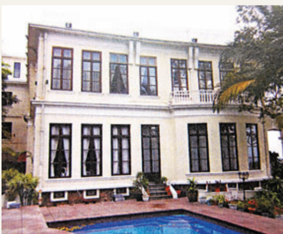
■ 山頂盧吉道27號大宅外觀。

香港文匯報訊（記者 鄭治祖）城市規劃委員會於上月初通過將二級歷史建築、盧吉道27號大宅，改劃為精品古蹟酒店，民間團體「美港聯盟」稱盧吉道既狹窄又繁忙，興建酒店將影響區內居民，又批評酒店的化糞池的氣味會影響山徑，質疑城規會未有充分考慮各項負面影響下就草率通過申請。城規會昨日發表聲明，委員會是在詳細考慮各項相關規劃因素，包括規劃意向、土地用途協調、擬議發展在環境、景觀、交通及基礎設施等方面的影響，政府部門意見，包括環境保護署對污水處理及運輸署對交通方面的意見及公眾意見後，在有附帶條件下批准該項申請。