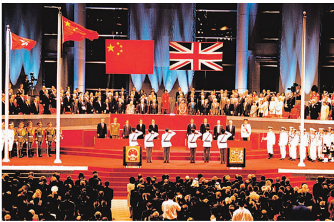
■ 1997年7月1日，中國政府恢復對香港行使主權，圖為香港政權交接儀式。