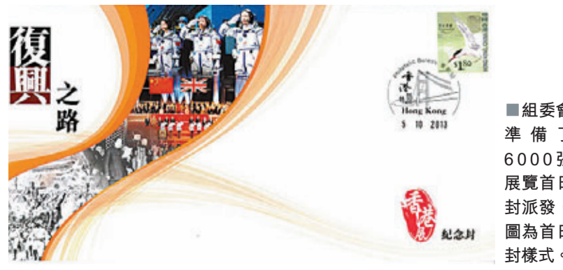
■ 組委會準備了6000張展覽首日封派發，圖為首日封樣式。