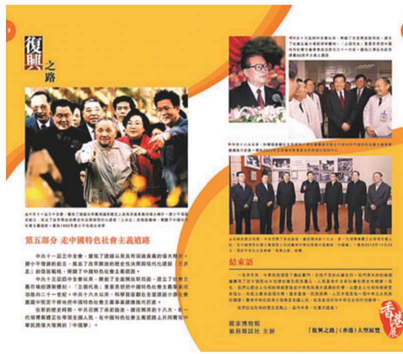
■ 展覽第五部分介紹中國特色社會主義道路。

香港文匯報訊「復興之路」（香港）大型展覽經過緊張的前期籌備，今日在香港會議展覽中心舉行簡短而隆重的開幕典禮。據悉，全國政協副主席董建華，香港特區政府署理行政長官林鄭月娥，中聯辦主任張曉明、副主任楊健，外交部駐港特派員姜瑜等將出席開幕禮。