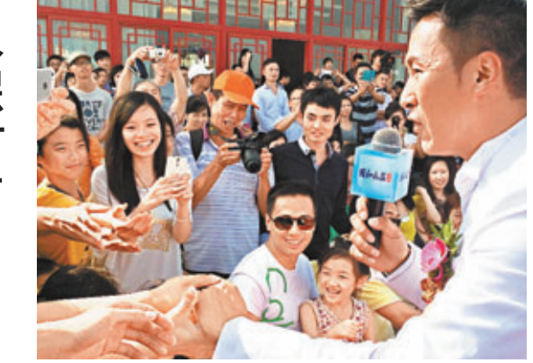
手傷的馬德鐘與觀眾握手。

香港文匯報訊（記者 李思穎）馬德鐘日前拍攝《飛虎II》的煞科爆破場面時受傷，證實右手膊頭有二條韌帶撕裂，不過德鐘前日出院後仍繼續工作，出席廣州的活動，他更被觀眾熱情打動竟落台握手，完全忘記手部受傷，全程便以左手握手，相當敬業。德鐘昨日前往廣州出席活動，適逢是「十一」國慶假期，道路大塞車，原本2.5小時的車程，竟然用了4個多小時才到達，最初德鐘以手托保護右手，當到達現場後，他便脫去手托，一身有型打扮登場，以示尊重大會。當日出席藝人尚有連詩雅，二人一起進行開盤儀式及與現場觀眾玩遊戲，德鐘更開腔演唱《中國人》和飛虎主題曲《身邊的依據》，台下反應熱烈，完全投入的德鐘無懼手傷，竟走到台下跟觀眾握手，此舉，令大會甚為緊張，而德鐘亦只能以左手握手，但已經令全場氣氛高昇，主辦單位大讚德鐘專業，日後希望有更多合作機會。風塵僕僕的德鐘完成廣州活動後，旋即趕返港為當晚獎門人錄影。