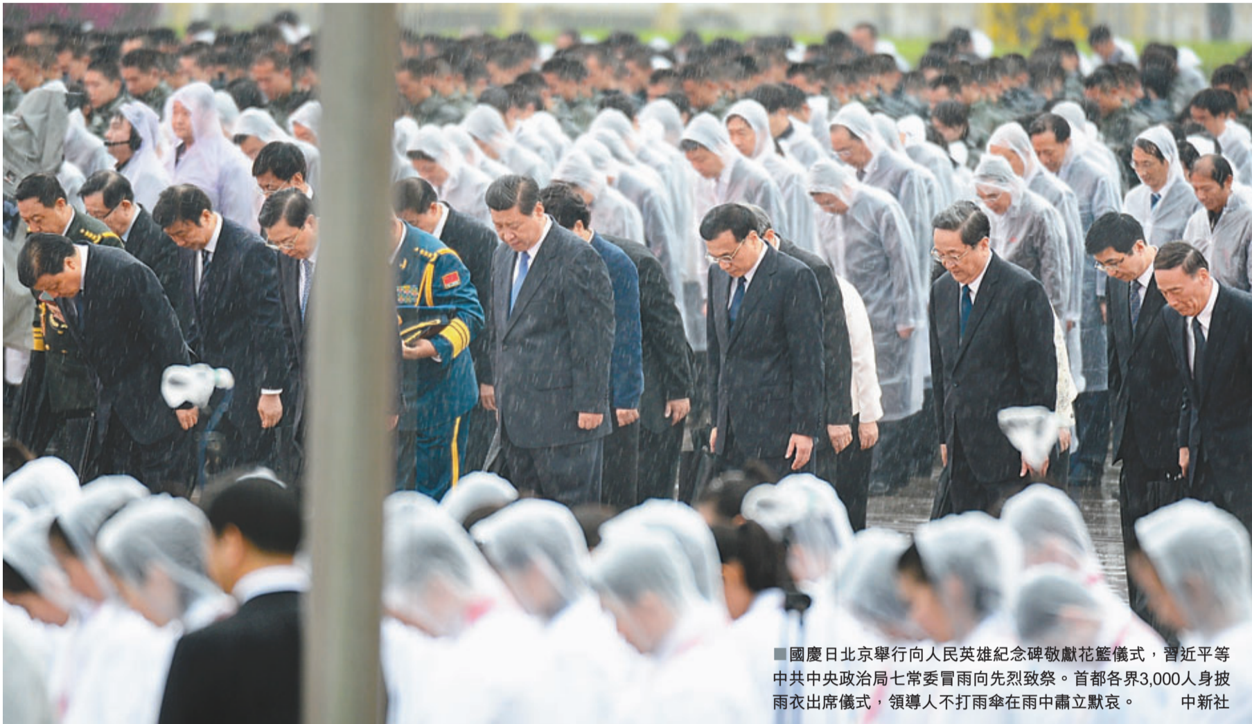
國慶日北京舉行向人民英雄紀念碑敬獻花籃儀式，習近平等中共中央政治局常委冒雨向先烈致敬。首都各界3,000人身披雨衣出席儀式，領導人雨中肅立默哀。

昨天的儀式，是中國官方自2010年以來連續4年在國慶日舉行向人民英雄紀念碑敬獻花籃儀式。中共中央政治局委員、北京市委書記郭龍金主持儀式。