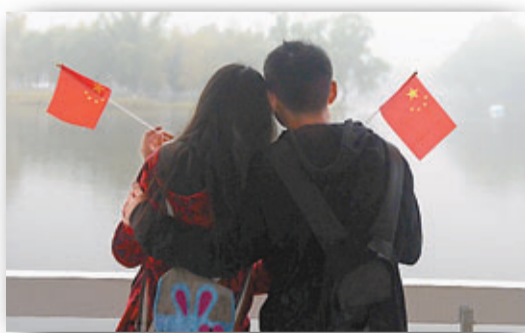
一對小情侶國慶日遊覽哈爾濱太陽島，手執國旗曬恩愛。 新華社