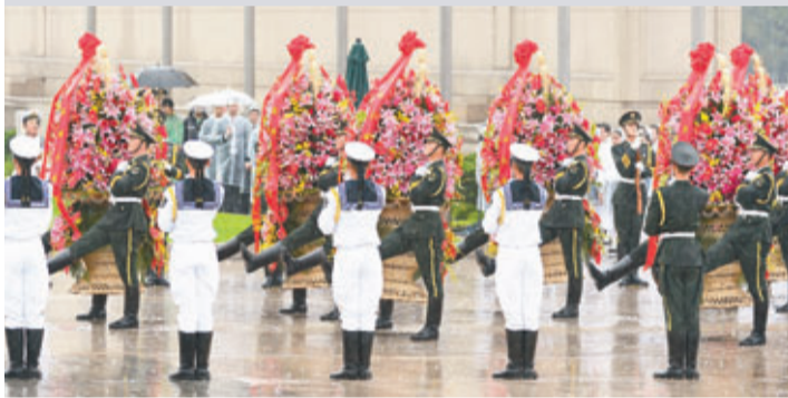
禮儀兵向人民英雄紀念碑敬獻花籃。