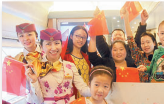
旅客在列車上歡度國慶。