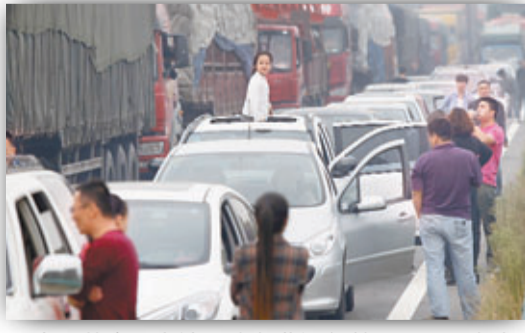
十一黃金周高速公路免費通行首日，全國各主要幹道又出現堵車「盛況」。