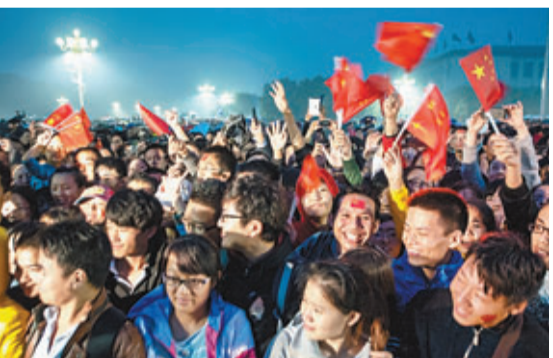
11萬來自各地民眾國慶日聚集天安門廣場，冒雨觀看升旗儀式。