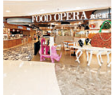
■食代館內，匯聚多國佳餚。

新世紀廣場最近引入多間來自不同國家的美食，當中更包括香港首間或最新概念店，例如全港首個高級版美食廣場FOOD OPERA食代館、旺角首間的一田超市，而日式食肆千兩亦以嶄新面貌示人。此外，名店如吉列豬排專門店銀座梅林，好評如潮的泰式餐廳Greyhound Cafe，以至地方菜式中菜廳如上海小南園、北京樓、百樂潮州酒樓等亦相繼於上個月及今個月在場內開業，帶來多國的美食，場內多間食肆同時放送推廣優惠。