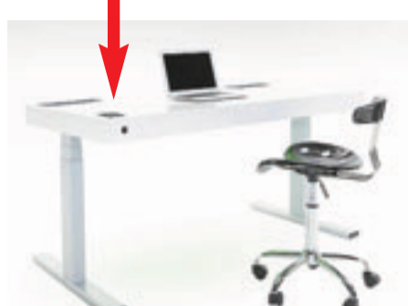
智能書桌可調整高度，左下角的觸控屏幕除可用作控制，亦可顯示用戶坐與站的時間等資料。