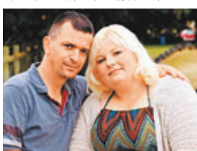
斯塔林與未婚夫湯普森。