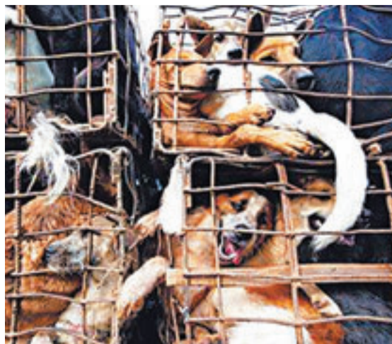
被囚在籠中的狗，無路可走。