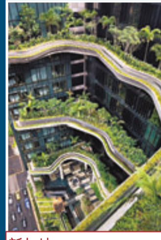
新加坡 PARKROYAL on Pickering

「已落成建築：酒店與休閒」獎項入圍名單部分 中國香港港島英迪格酒店 (凱達環球) 設計從周邊環境取得靈感，將建築學、室內設計和景觀完美結合之餘，融入灣仔本地文化，讓外國住客感受到香港氣息。 日本靜岡縣日本平飯店 (日建設計) 富士山和駿河灣一覽無遺，又不失日本傳統室內設計風格。 中國廣州W酒店 (許李嚴建築師事務所) 坐落珠江新城區中心地帶，設計師將酒店和住宅單位優雅地融入該區，解決大規模建築項目面臨的挑戰。 新加坡PARKROYAL on Pickering (WOHA建築事務所) 位於新加坡市中心，以綠色環保為主題的外觀設計，將植物與景觀融為一體。