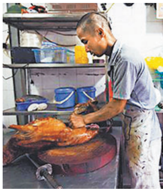
狗肉店員工在處理狗肉。