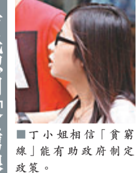
丁小姐相信「貧窮線」能有助政府制定政策。

項政策以紓緩貧窮情況,例如針對長者貧窮推出了長者生活津貼;委託香港大學社會工作及社會行政學系教授周永新及其團隊就香港退休保障進行研究;優化「鼓勵就業交通津貼計劃」,容許受助人以個人或住戶為申請單位;提高法定最低工資水平至時薪30元等。 梁振英又勉勵各界一同解決社會問題,「『心』在人身體之中的力量最大,只要用心就可將事情做好;希望可以做到人人為我、我為人人。」他希望700萬港人可秉持「家是香港」的理念,解決所有難題。