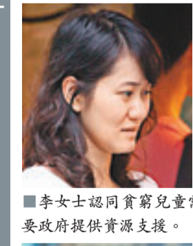
李女士認同貧窮兒童需要政府提供資源支援。