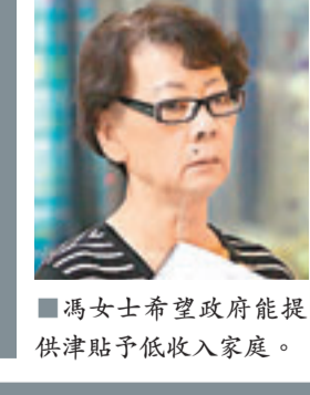
馮女士希望政府能提供津貼予低收入家庭。