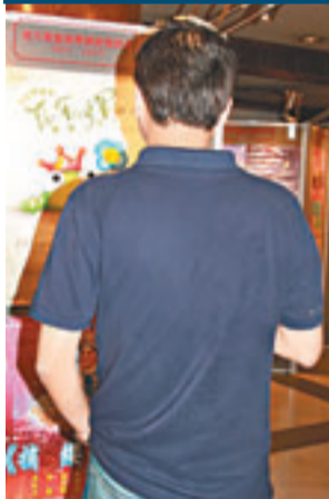
吳先生一家三口只靠8,800元月入生活。

香港文匯報訊(記者 聶曉輝、劉雅勤)香港現時的失業率降至3.3%,但在職貧窮的問題仍然嚴重,佔全港總貧窮人口一半,達53.7萬人,反映即使就業並非代表可以