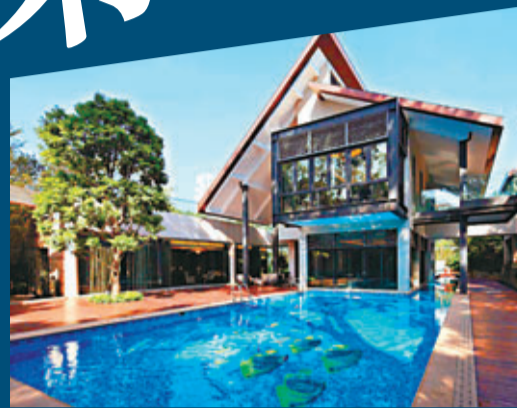
■此樓已售出，售價為一億元人民幣。

目前，別墅小區的園林投資已近6億元，園林中樹木逾200種，比一般植物園還要多。在植物類別上，一年四季都有開花的品種。人造園林自然離不開石頭，據稱大一大山莊所用石頭不管是石山還是石砌小路，全是在外購買的。正在建設的北區用石2,500噸。值得一提的是，由於工程進度原因，經過這幾年未開盤，反令小區擁有了成型的植被。