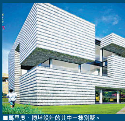
■馬里奧·博塔設計的其中一棟別墅。