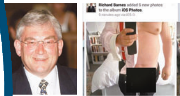
巴恩斯否認是自己上載露械照。

英國倫敦前副市長巴恩斯的facebook(fb)帳號前日突然出現一張裸露下半身的自拍照，他沒回應相中人是否他本人，卻聲稱帳號遭入侵，不是自己上載。不過有報道則認為，是他利用iPhone自拍後，照片經fb應用程式(app)自動上載所致。