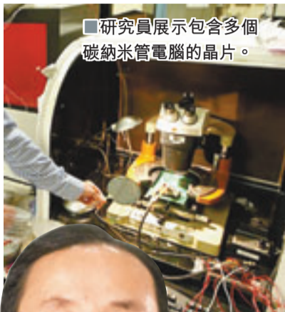
研究員展示包含多個碳納米管電腦的晶片。