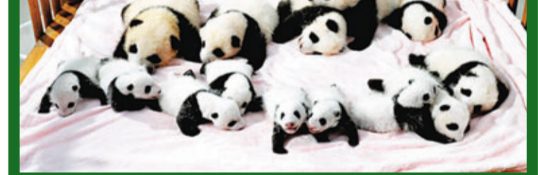
在保證「種群質量」優先的前提下，成都圍養大熊貓繁育再獲豐收。9月23日，14隻今年新生大熊貓寶寶集體在成都大熊貓繁育研究基地月亮產房亮相，萌翻前來參觀的中外遊客。