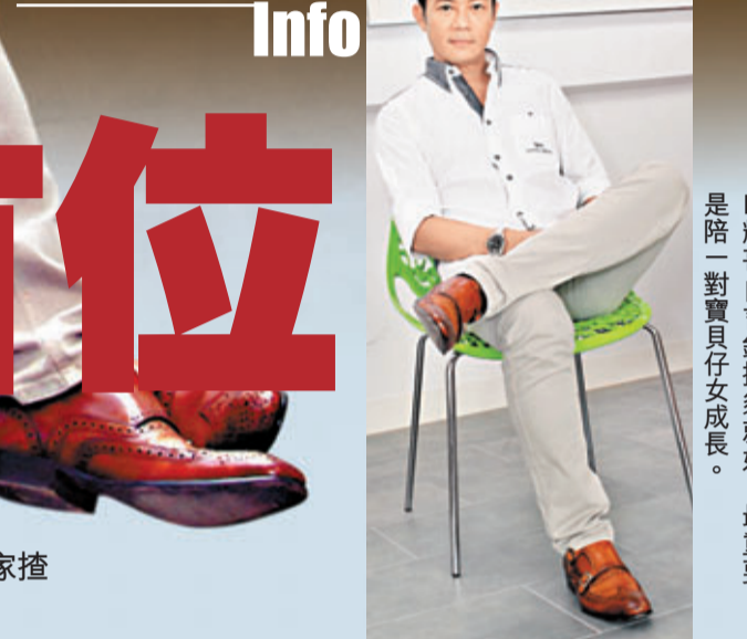
是陪一對寶貝子女成長，最重要。