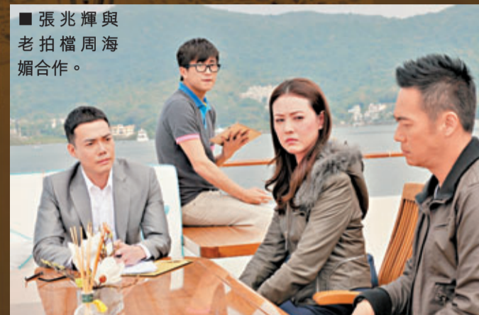
張兆輝與老拍檔周海媚合作。