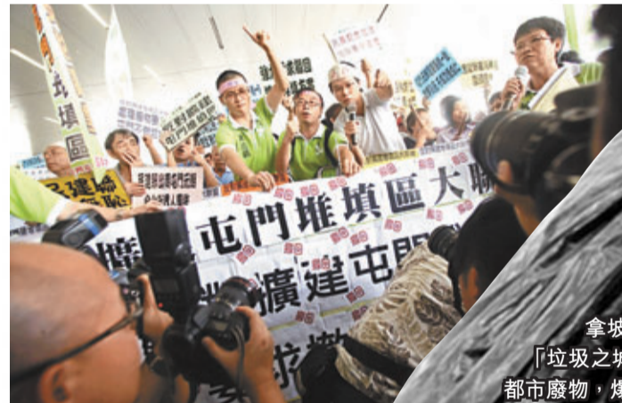
■約200名屯門和北區居民在立法會大樓外「大鑼大鼓」，要求財委會否決擴建堆填區撥款。 資料圖片

2.拿坡里地方政府的施政「效率低下，更貪污腐化」，居民已經長期積累着憤怒。早於上世紀90年代