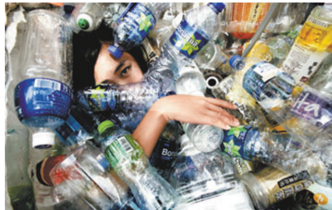
地球之友帶同千個回收膠樽，要求督導委員會檢討部門協助回收工作欠承擔及協調。 資料圖片

中，該地區已經設立「垃圾專員辦公室」，專責處理城市垃圾的問題，但多年來問題不單沒能解決，官僚體制更讓問題不斷惡化。