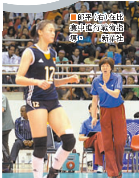
郎平(右)在比賽中進行戰術指導。

當天在泰國呵叻府80周年體育場查差體育館進行的比賽中，面對曾在複賽中3：0橫掃的手下敗將韓國隊，中國隊首局狀態良好，以25：13先下一城；第二局中國隊保持了第一局的良好勢頭，以25：17又拿下一局，大比分2：0領先。但就在大家都以為勝利在望、3：0橫掃韓國隊的戰果即將再現的時候，韓國隊從第三局開始扭轉局面，中國隊開局3：5落後，金延璟發揮威力，雙方分數緊咬，而中國隊失誤較多，最終韓國隊以25：21扳回一局。第四局韓國隊乘勝追擊，中國隊依然處於士氣不振的狀態，扣球屢屢被攔，最終韓國隊以25：23將大比分扳成2平。第五局韓國隊士氣高昂，中國隊則顯得有些疲憊不堪。在現場泰國觀眾的助威聲中，韓國隊最終以15：11拿下末局，贏得比賽勝利。