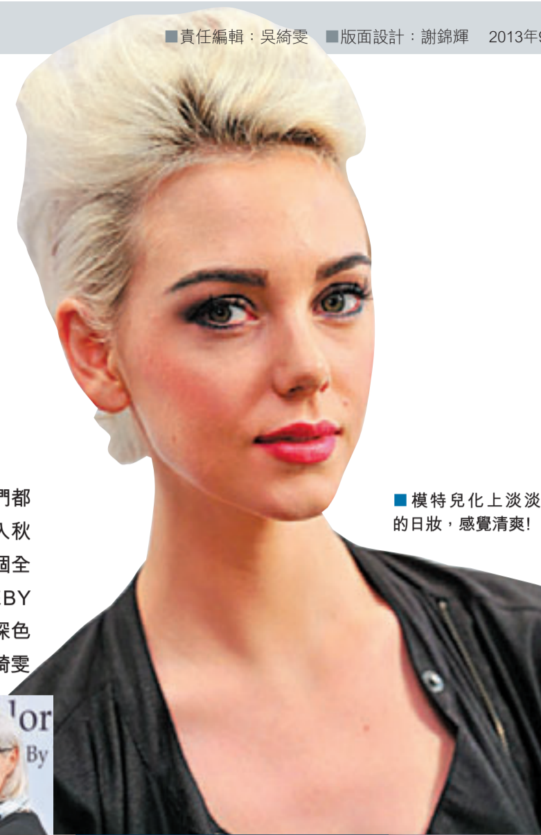
■模特兒化上淡淡的日妝，感覺清爽！