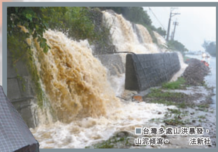
台灣多處山洪暴發，山泥傾瀉。