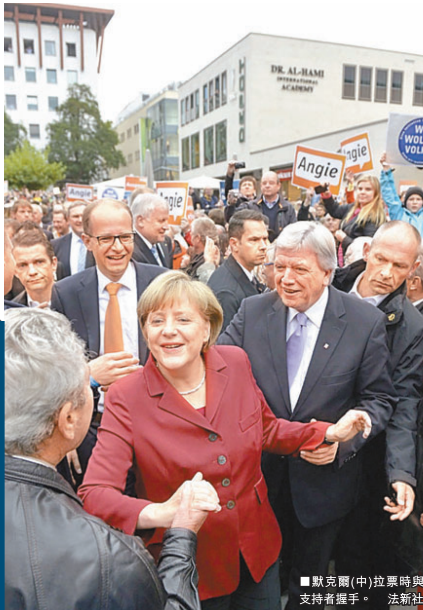
■默克爾(中)投票時與支持者握手。

德國明日大選，總理默克爾領導基督教民主聯盟(CDU)，與主要對手、反對派社會民主黨(SPD)黨魁施泰因布呂克正面交鋒，冀再度連任。默克爾帶領德國安度歐債危機，但最新民調顯示，執政聯盟與SPD等在野黨合起來的民望不分高下，皆未能過50%，且疑歐派政黨有機會首次晉身國會，或迫使默克爾與反對派組成大聯盟政府。分析指，疑歐派登場將震動歐元區及金融市場。