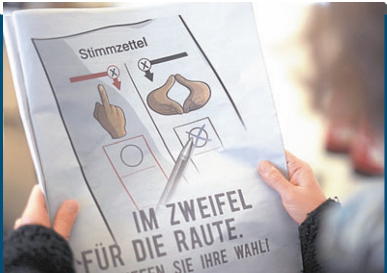
■選舉廣告中以中指代表施泰因布呂克，菱形手勢代表默克爾。