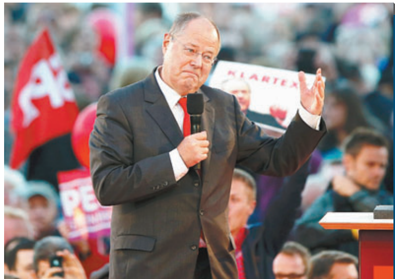
■反對派黨魁施泰因布呂克脾氣暴躁，曾被拍到舉中指。