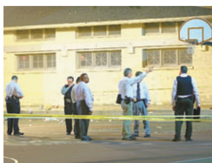
■警方在槍擊案現場搜證。

美國警方表示，芝加哥南區前晚深夜發生槍擊案，造成13人受傷，當中一名3歲幼童被射中臉頰，有生命危險，另有兩名傷者情況危殆。警方相信案件涉及幫派暴力。