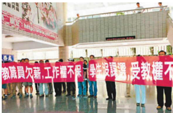
屏東縣一技術學院老師被欠七個月薪水，在校內抗議。

目前島內大專院校暴增到170多所，但台灣少子化問題非常嚴峻，院校面臨供過於求的局面。台灣1997年出生人數約32萬人，到2005年只剩20.5萬人，短短8年間減少12萬人。推估2014年後入學的高中職新生，每年將遞減