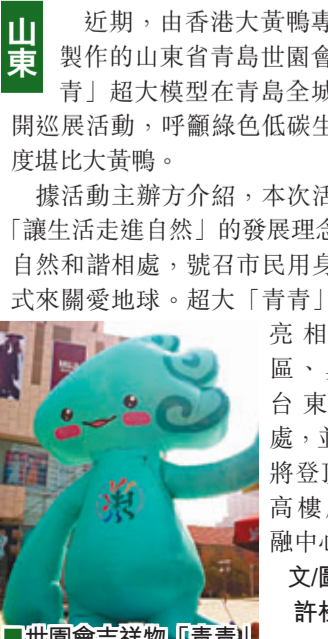
世園會吉祥物「青青」

近期，由香港大黃鴨專屬製作公司製作的山東省青島世園會吉祥物「青青」超大模型在青島全城各大商圈展開巡迴活動，呼籲綠色低碳生活，震撼程度堪比大黃鴨。