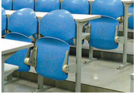
台灣生育率低致多家學校收生不足。

香港文匯報訊 據中社社報，因「少子化」(指生育率下降，造成幼年人口逐漸減少)現象導致台灣近年擴張過度的私立大專校招生不足，部分學校出現積欠教職員薪水的問題，為維護教育品質，台當局研議提出私校退場(即「被殺校」)機制，以協助私校退場與轉型後的良性發展。據台灣教育部新訂的私校退場指標，目前有12所高中職、2所一般大學及6所技專院校共20所私校列入輔導名單。若輔導後仍無法改善，就會走上解散、整併或轉型的「退場」之路。