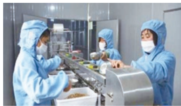
■ 引進企業進行精細加工

質量優良： 縣域周圍5000平方公里內無污染、無公害，所產中藥材有效成分含量高。經檢測，種植的三年生黃芪，含黃芪甲苷0.09%（《中國藥典》規定不得少於0.04%）；柴胡浸出物為18.2%（《中國藥典》規定不得少於11%）；二年生黃芩含黃芩苷14.6%，三年生黃芩含黃