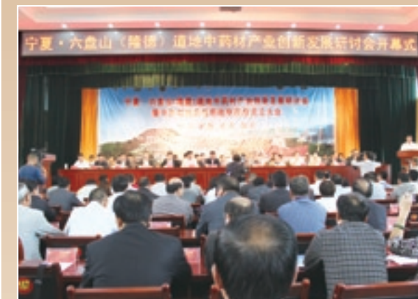
■ 中藥材產業研討會