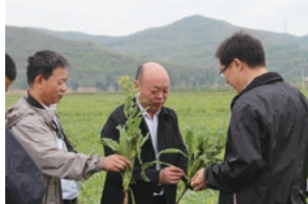
■ 中藥材產業研討會上專家學者實地考察藥材種植基地

面對國內中藥材市場快速發展的機遇，隆德穩中求進，讓中藥材發展猶如製作一服良藥：備齊上好藥材，慢慢用溫火煎熬，最終成為一劑富民良藥。