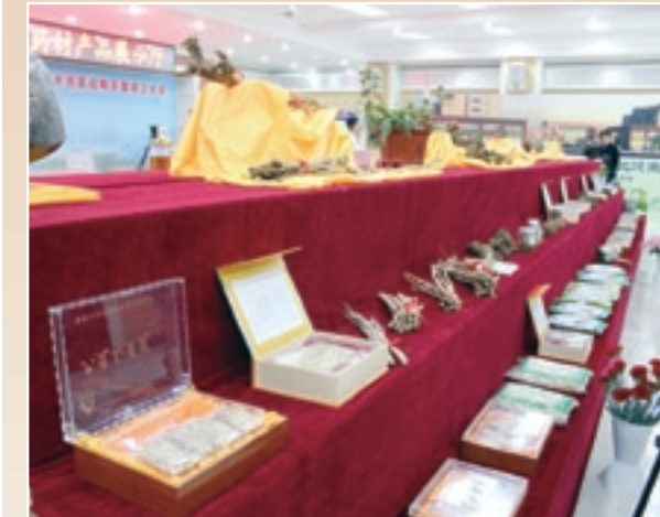
■ 中藥材產業研討會上展示着琳琅滿目的中藥材