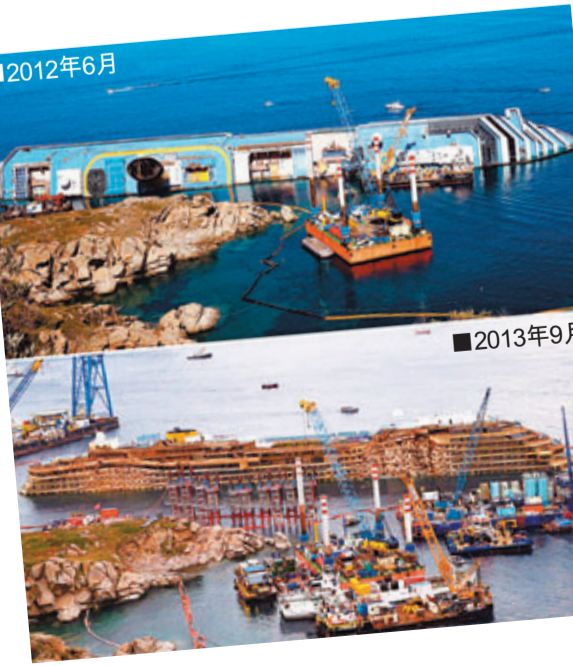
意大利郵輪「協和」號去年初在吉廖島觸礁沉沒，船身擱淺傾覆。打撈人員經過19小時的努力，昨日終於扶正船身，稍後將維修損