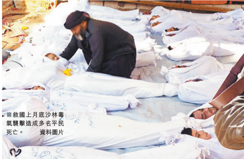
■敘國上月底沙林毒氣襲擊造成多名平民死亡。 資料圖片