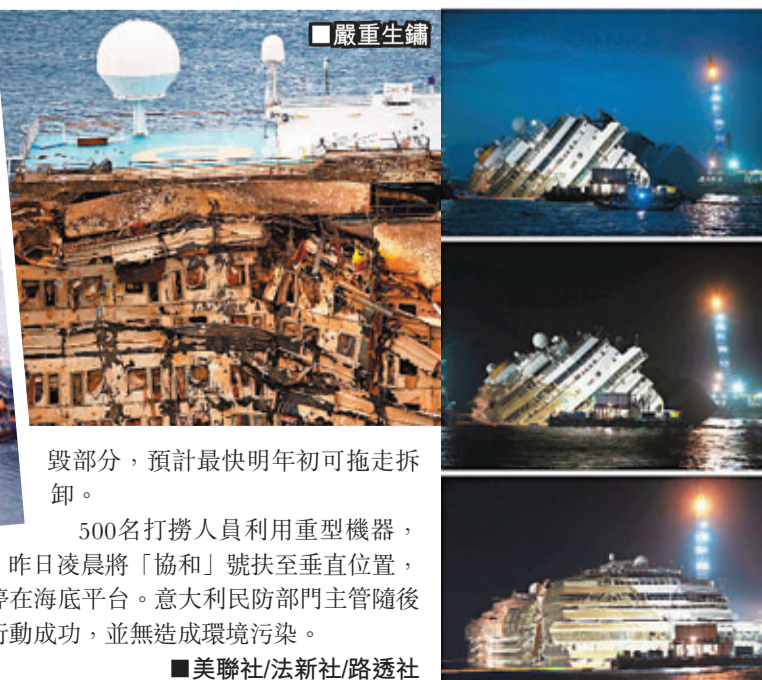
毀部分，預計最快明年初可拖走拆卸。500名打撈人員利用重型機器，昨日凌晨將「協和」號扶至垂直位置，暫時停在海底平台。意大利民防部門主管隨後宣布行動成功，並無造成環境污染。