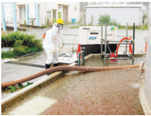
■工作人員把污水池旁的雨水抽走。

國際原子能機構(IAEA)年度大會前日舉行，日本核污水洩漏成為焦點。外國專家批評日方未有盡早採取對策，一直只把輻射水儲在儲存罐內，至今仍未找到最終解決方案。法國專家則批評日方未有第一時間公布核污水洩漏。日本科學技術擔當相山本一太回應稱，正致力改善資訊透明，並將採取措施解決問題。另外，