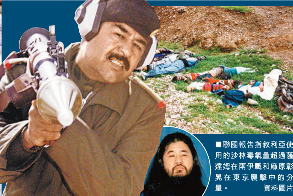
■聯合國報告指敘利亞使用的沙林毒氣量超過薩達姆在兩伊戰和麻原彰晃在東京襲擊中的分量。

聯合國秘書長潘基文前日向安理會成員國公布長38頁的敘利亞化武調查報告，內容提及有人從西北地區發射裝有350公升沙林毒氣的對地火箭，數量比1995年東京地鐵毒氣案及1988年伊拉克薩達姆政府攻擊伊朗所用的更多。