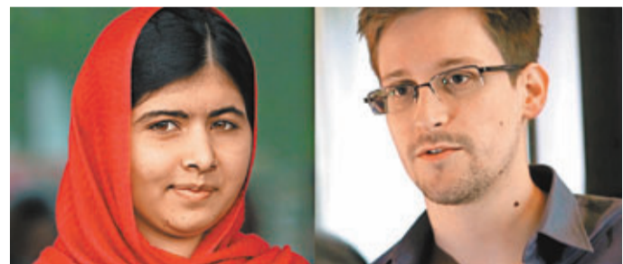
■瑪拉拉和斯諾登均獲提名歐盟人權獎。

俄羅斯傳媒引述協助美國中情局前僱員斯諾登的律師庫切連納表示，斯諾登現居俄國一個秘密地點，由保安人員保護，但可自由活動，遊覽期間無人認出。他透露斯諾登仍有未公開機密文件，並有意從事人權工作。